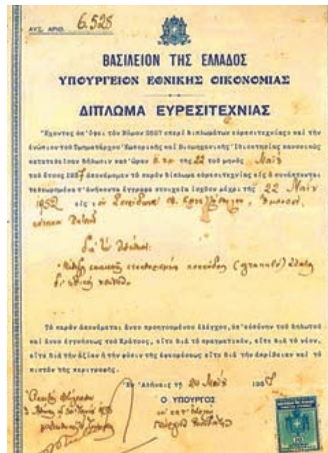
⦿ Δίπλωμα ευρεσιτεχνίας του 1937

το φούρνιζε, το καθαίριζε από τις πέτρες και το πωλούσε σε σάκους στα εδωδιμοπωλεία της περιοχής. Μάλιστα, πωλούσε το αλάτι και σε χάρτι-