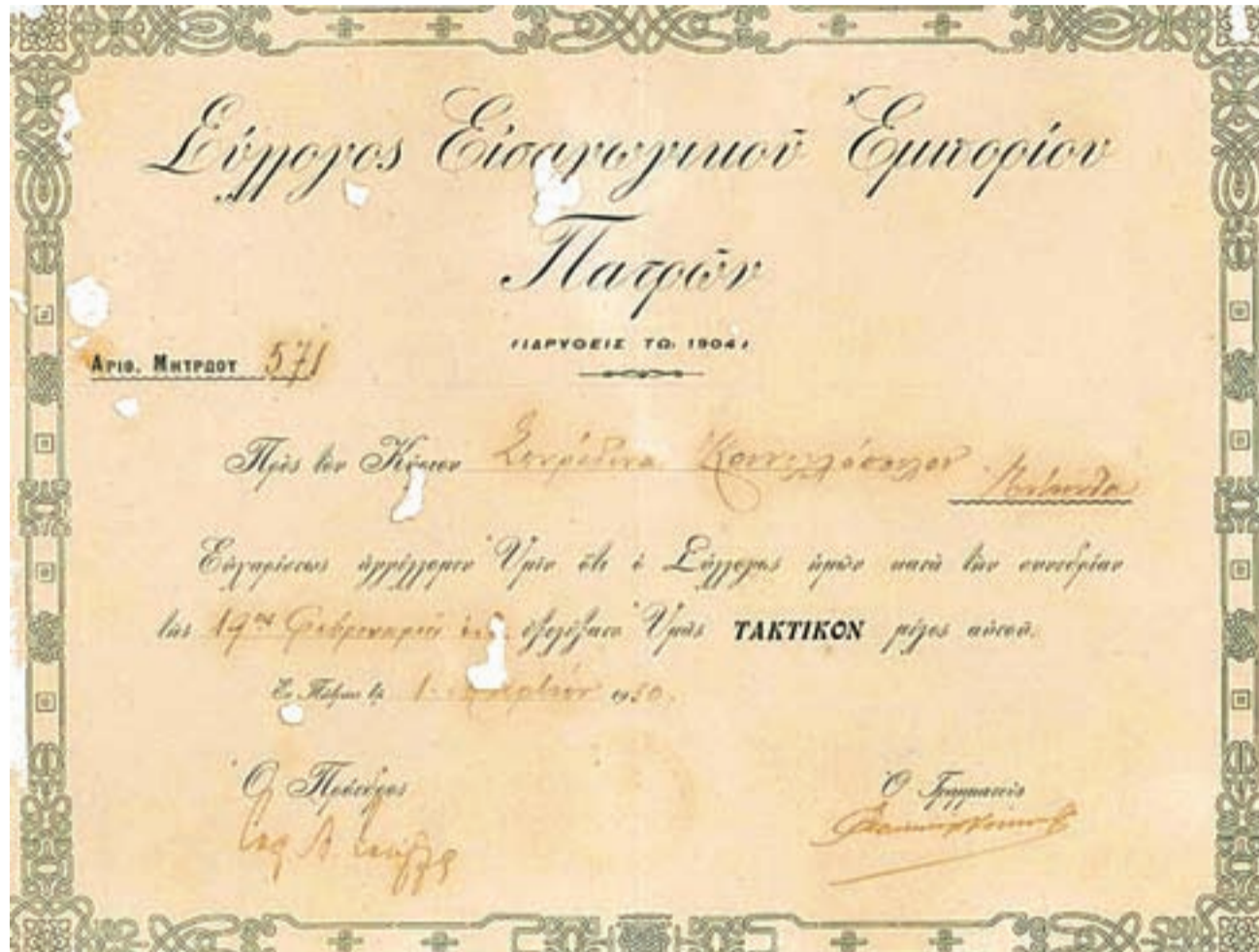
⦿ Εκλογή του Σπύρου Κανελλόπουλου στον Εισαγωγικό Σύλλογο

Ο Σπύρος Κανελλόπουλος , αγόραζε αλάτι Μεσολογγίου, από τις αποθήκες του μονοπωλίου, το έπλενε,