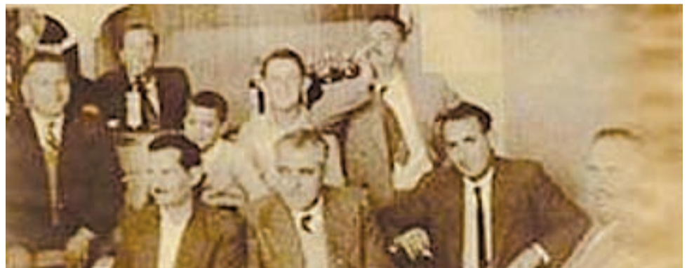
Οικογένεια Χάχαλη σε στιγμιότυπο εκείνης της εποχής

Η ποτοποιία "ΤΕΝΤΟΥΡΑ ΚΑΣΤΡΟ - Γ.Π. ΧΑΧΑΛΗΣ" είναι 100% ελληνική εταιρεία και μία από τις πιο γνωστές και παραδοσιακές της περιοχής των Πατρών. Πρόκειται για μία οικογενειακή επιχείρηση της οποίας οι ρίζες ξεκινούν τον 19ο αιώνα στην "μυροβόλο" Χίο, γνωστή στον κόσμο για την μοναδικότητα της παραγωγής μαστίχας.