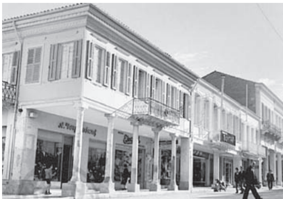
☛ Όταν είχε έδρα στην οδό Φιλοποίμενος στο ιστορικό κέντρο της Πάτρας

1986: Με σύγχρονες εγκαταστάσεις και με αυξημένη παραγωγική δυναμικότητα, προχωράει σε διαφημιστική καμπάνια και λανσάρει πανελλαδικά τα αναβαθμισμένα ποιοτικά προϊόντα της.