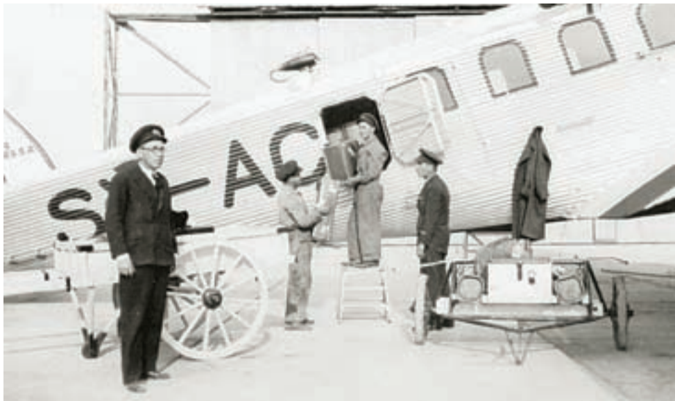
☛ Εν ώρα εκφόρτωσης πρώτων υλών για τις ανάγκες της επιχείρησης