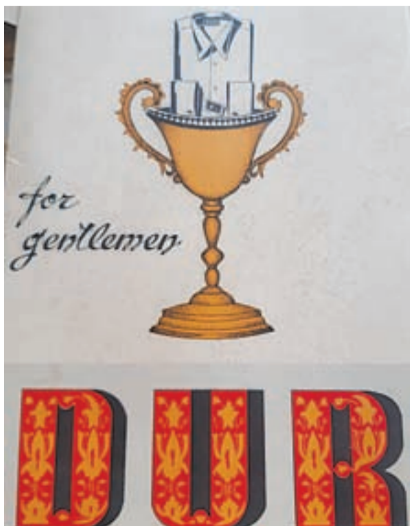
☛ Διαφήμιση εποχής