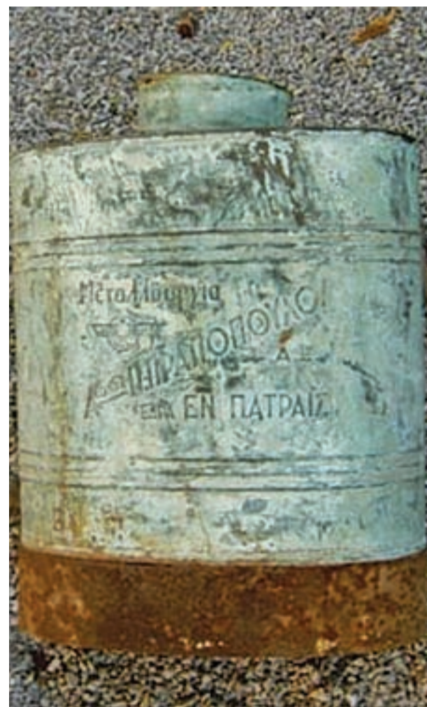
☛ Ψεκαστήρας της εταιρείας

Την δεκαετία 1910 - 1920 η εταιρεία διέθετε πλεόνασμα εγκατεστημένης ισχύος και ήταν σε θέση να πουλά ρεύμα σε ιδι-