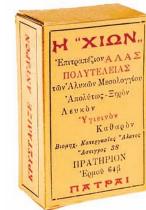
⦿ Από καταχώριση της εποχής

να κουτιά οικιακής χρήσης, γεγονός που ήταν πρωτοποριακό για την εποχή. Ήδη, από πολύ νωρίς το 1937, του αποδόθηκε δι-