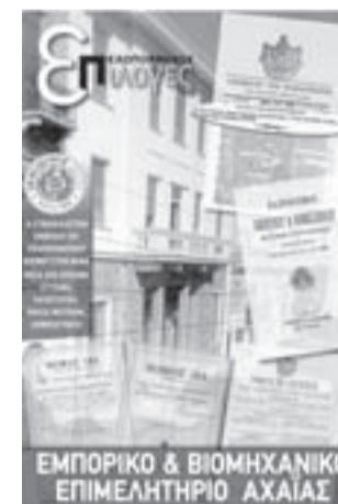
«Πελοπόννησος» Σάββατο 25 Ιουλίου 2015

Είναι η δεύτερη φορά που οι «Επιλογές» της «Πελοποννήσου» καταπιάνονται με τον εμπορικό κόσμο της Πάτρας. Η αρχή είχε γίνει το 2015 με το αφιέρωμα στο Εμπορικό Επιμελητήριο. Όλα μας τα τεύχη είναι διαθέσιμα στα γραφεία μας (Μαιζώνος 206 και Παπαφλέσσα) για όποιον επιθυμεί να έχει ακεραία τη σειρά.