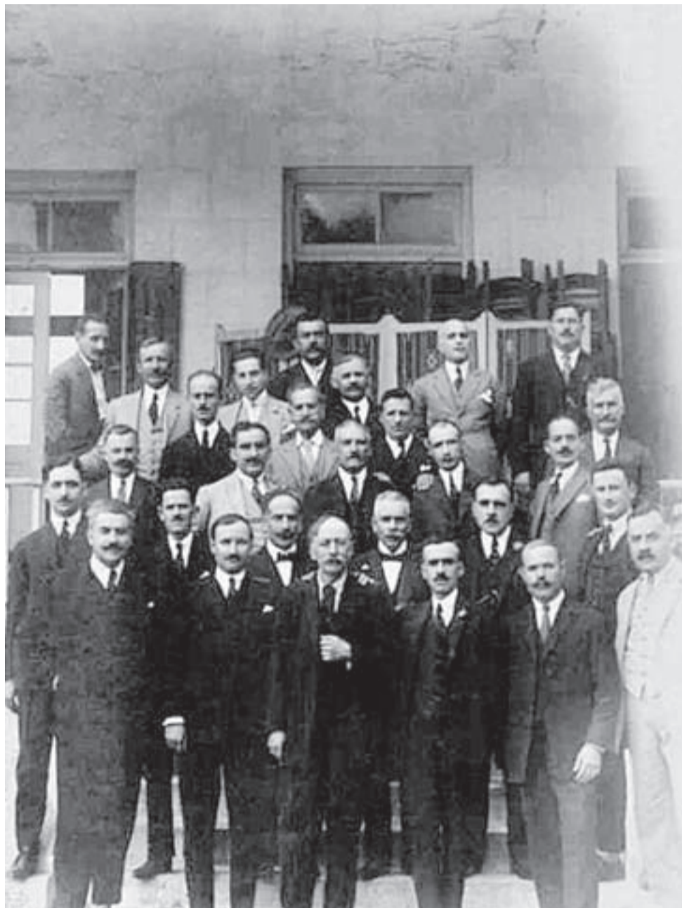
❖ Τα εγκαίνια του Επιμελητηρίου στις 31 Μαΐου 1925

ΕΠΑΓΓΕΛΜΑΤΙΚΟΝ ΚΑΙ ΒΙΟΤΕΧΝΙΚΟΝ ΕΠΙΜΕΛΗΤΗΡΙΟΝ