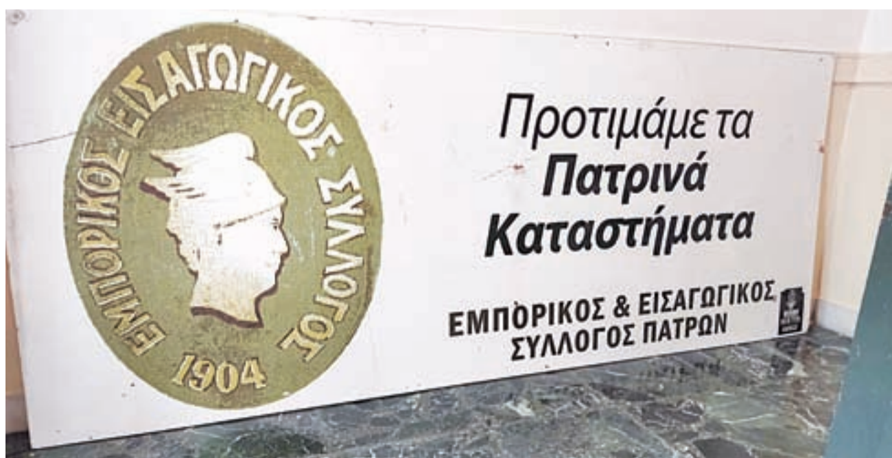
☞ Παλιά πινακίδα που βρίσκεται στα γραφεία του στον «Ερμή»

ΑΝΩΤΑΤΟ ΟΡΓΑΝΟ: Η Ετήσια ΓΕΝΙΚΗ ΣΥΝΕΛΕΥΣΗ των Μελών του