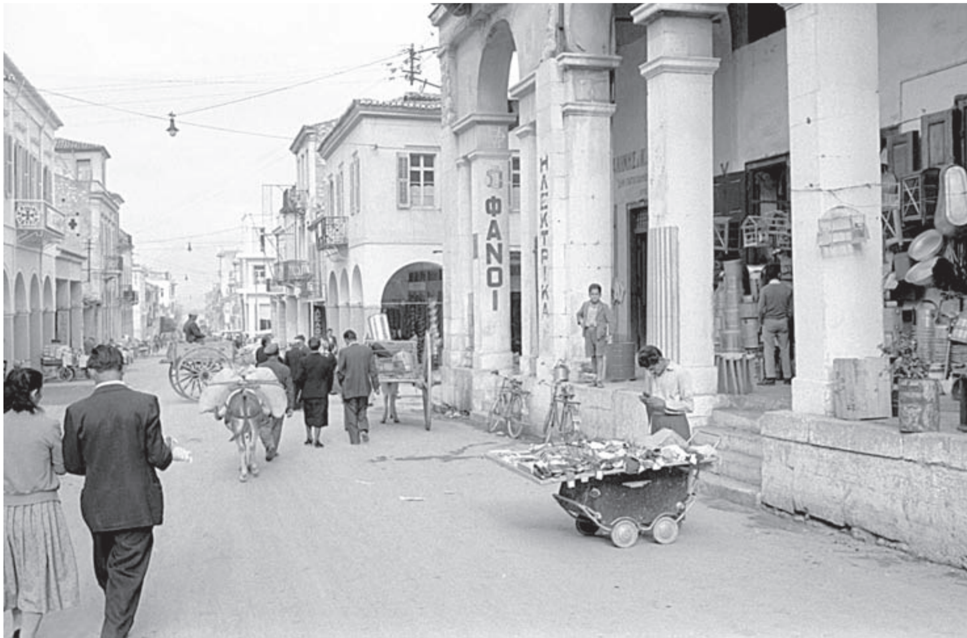
☛ Νοέμβριος του 1958, στο Μαρκάτο. Σήμερα είναι το Αστυνομικό Μέγαρο (Ερμού & Καραϊσκάκη). Τότε υπαίθριοι μικροπωλητές, καρτσέρηδες, παντοπωλεία κ.λπ.

ΠΟΛΛΑ ΑΠΟ ΑΥΤΑ ΧΑΘΗΚΑΝ ΣΤΟ ΔΙΑΒΑ ΤΩΝ ΔΕΚΑΕΤΙΩΝ ➔ ΑΛΛΑΞΑΝ ΟΙ ΣΥΝΘΗΚΕΣ ΚΑΙ ΟΙ ΕΠΟΧΕΣ