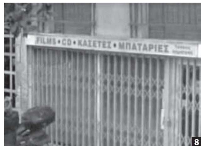
8 Σήμερα μόνο μπαταρίες μπορεί να χρειαστεί κάποιος (google maps)