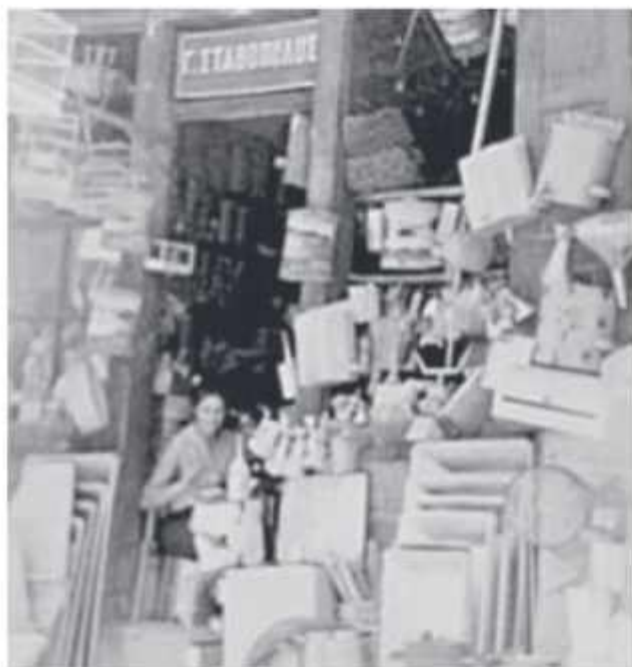
☉ Το παντοπωλείο Γ. Σταθόπουλου