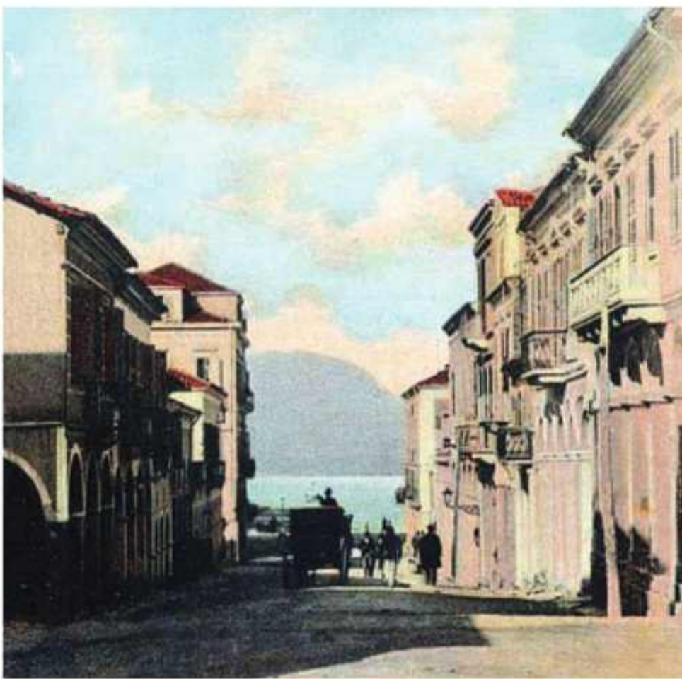
● Κατεβαίνοντας με την άμαξα στην Κολοκοτρώνη, κάτω από τη Ρήγα Φεραίου