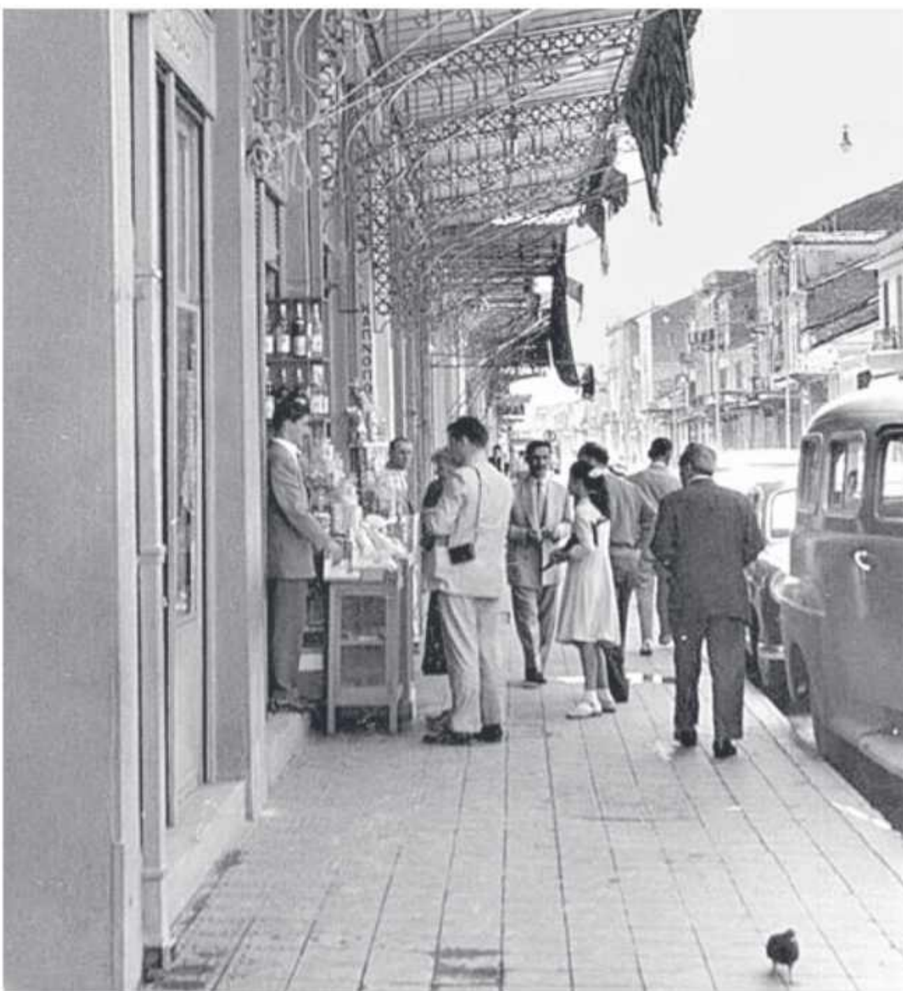
☉ Σε ένα μανάβικο στην οδό Αγίου Ανδρέου, πλησίον με την Αγίου Νικολάου το 1956

➔ ΟΙ ΕΠΑΓΓΕΛΜΑΤΙΕΣ ΚΑΙ ΟΙ ΕΠΙΧΕΙΡΗΣΕΙΣ ΜΑΣ κατά τον 19ο και τον 20ό αιώνα είχαν κατατάξει την Αχαΐα στην πρωτοπορία της Ελλάδας και της Ευρώπης. Είχαν φέρει ανάπτυξη, ευημερία και πολιτισμό. Σήμερα, δυστυχώς, διανύουμε την πιο «σκοτεινή» περίοδο. Οι επιχειρήσεις και οι επαγγελματίες πλήττονται, ενώ η Αχαΐα είναι στις τελευταίες θέσεις σε όλους τους δείκτες. Η παράταξη «Επιμελητήριο Πρωταγωνιστής» ιδρύθηκε για να μετατρέψει το Επιμελητήριο από «απόντα» σε «πρωταγωνιστή» της προσπάθειας να πάρει ξανά η Αχαΐα τη θέση που της αρμόζει στην Ελλάδα και την Ευρώπη. Στο πλαίσιο αυτό, σας προσφέρουμε μια σειρά Ενθέτων που περιγράφουν την ένδοξη ιστορία των επιχειρήσεων και των επαγγελματιών της Αχαΐας .