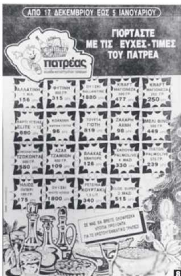
1 Ο αείμνηστος κυρ-Γιώργης μπροστά στον πάγκο του (αρχείο Παναγιώτη Πορφυρόπουλου) 2 Κρεοπωλείο στην οδό Γούναρη (και Κανακάρη) μέσα δεκαετία '50 (αρχείο Νίκου Σαραφόπουλου) 3 Το οπωροπωλείο Αγγελόπουλου (αρχείο Ζ. Μαυρίδου) 4 Το μπακάλικο του Σπυρόπουλου στο Μαρκάτο τη δεκαετία του '60 (αρχείο Δήμου Πατρέων) 5 Το μπακάλικο του Πορμώνη στη οδό Γερκωστοπούλου το 1994 (από το βιβλίο «Πάτρα» του Π. Σωτηρόπουλου) 6 Μπροστά στο ψηλικάζιδο της Θάλας Περπερίδου στην πλατεία Ελευθερίας τέλη δεκαετίας '60 7 Στο ψηλικάζιδο του Μπούσια τη δεκαετία του '50 8 Διαφήμιση για φθνά είδη διατροφής στο κατάστημα «Πατρέας» το 1990μ (αρχείο Οδυσσέα Ξεριζωτή)