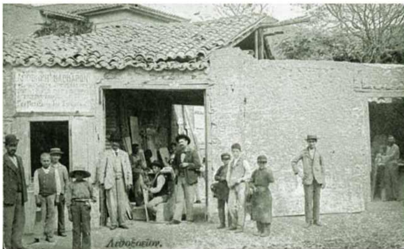
☉ Μικρά παιδιά, μεταξύ άλλων εργαζομένων, στο Λιθοξοείο - Αποθήκη μαρμάρων Γ. Μεταξά, κάπου στην Πάτρα το 1903. Καρτ - ποστάλ εκδόσεων Α.Β. Πάσσα (αρχείο Βασίλη Καραβασίλη)

Αξίζει να αναφέρουμε και τούτο. Σε εφημερίδες της εποχής διαβάζουμε ότι η καθαριότητα της πόλης ήταν ατελείωτη εκείνη την εποχή της αιχμής της. Ιδιαίτερα η περιοχή της σημερινής Ηφαίστου και μέχρι το Μαρκάτο ήταν γεμάτη ακαθαρσίες, περτώματα και γενικά βρωμίες.