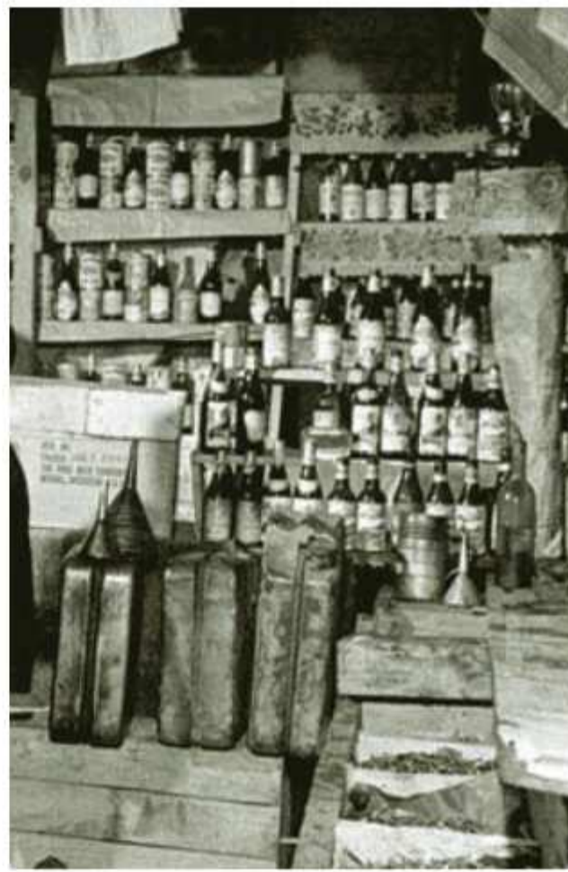
● Ράφια από μπακάλικο