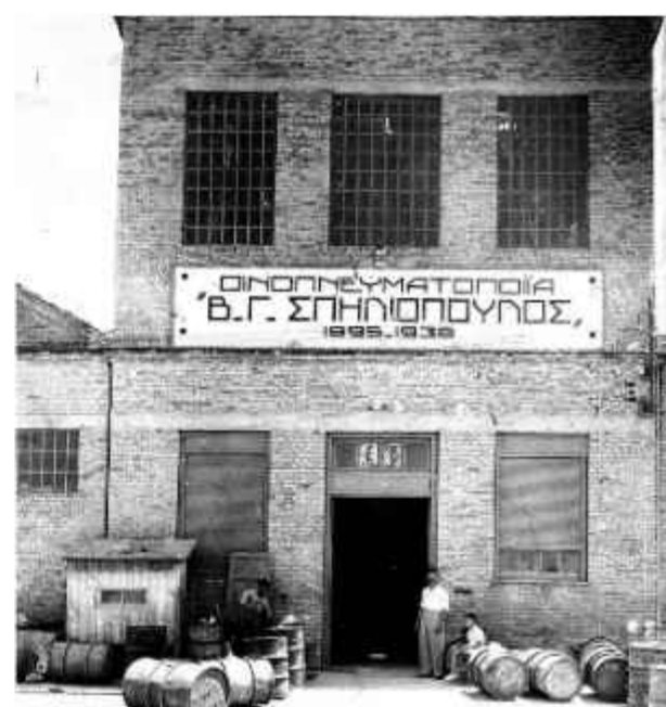
❖ Το κεντρικό κτίριο της οινοπνευματοποιίας Β. Γ. Σπηλιόπουλου το 1938. Το κτίριο αποτελεί τον αρχικό πυρήνα του εργοστασίου και έχει στοιχεία παραδοσιακής δόμησης

Σήμερα αποτελεί μία από τις μακροβιότερες εν ενεργεία ελληνικές βιομηχανικές μονάδες,