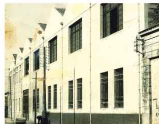
Τα κτίρια της πρώτης φάσης της Κλωστοϋφαντουργίας Β. Μαραγκόπουλου, στην οδό Μαιζώνος. Φωτογραφία αρχών δεκαετίας του '30. Οικοδομήθηκαν στα μέσα της δεκαετίας του '20 σε σχέδια του αρχιτέκτονα Ναζαρέτ Νουμπάρ

Τα υπάρχοντα κτίρια του Μαραγκόπουλου διακρίνονται για τις δύο οικοδομικές τους φάσεις, της δεκαετίας του '20, από οπλισμένο σκυρόδεμα με συνεκόμενες δόρριχτες κεραμοσκεπείς στέγες επί της οδού Μαιζώνος και της δεκαετίας του '30, επίσης από οπλισμένο σκυρόδεμα, με χαρακτηριστικά Μπάουκους