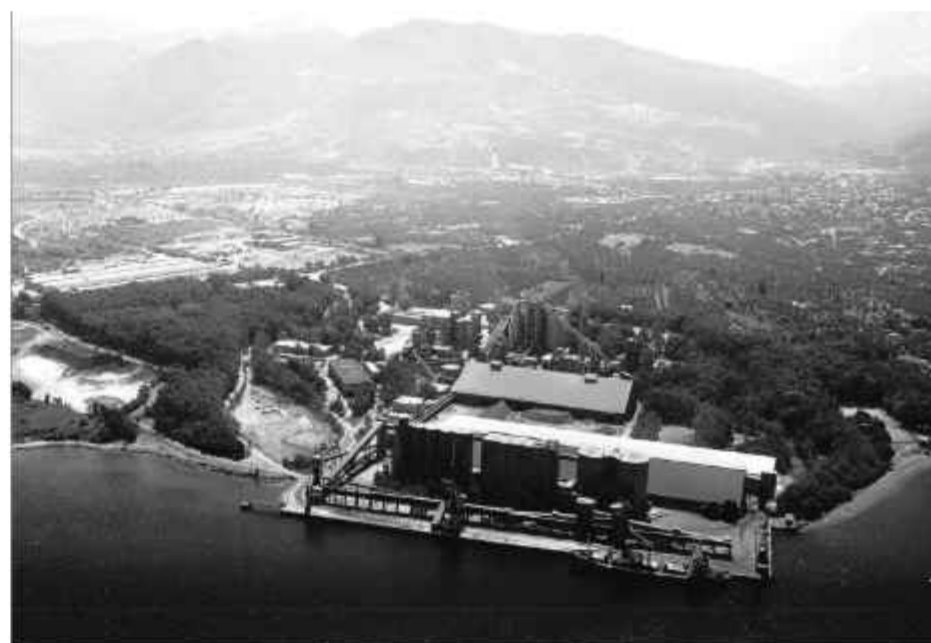
⊕ Αποψη από αέρος των εγκαταστάσεων της εταιρείας ΤΙΤΑΝ στο Δρέπανο

Η Ελληνική Εταιρία Τσιμέντων, το 1966, επέλεξε την περιοχή του Δρέπανου για να εγκαταστήσει μονάδα παραγωγής τσιμέντου, λόγω της προσβασιμότητας στις πρώτες ύλες και την προσεγγισι-