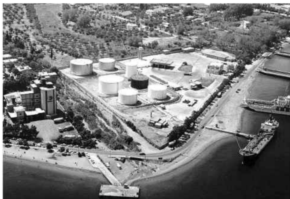
⊕ Αποψη από αέρος των εγκαταστάσεων της εταιρείας ΑΓΕΤ ΗΡΑΚΛΗΣ. Δεξιά διακρίνονται οι δεξαμενές καυσίμων της Shell Hellas ΑΕ

Οι αυξημένες ανάγκες της τοπικής αγοράς σε τσιμέντο οδήγησαν την Εταιρία ΑΓΕΤ ΗΡΑΚΛΗΣ να δημιουργήσει το 1963 βιομηχανική μονάδα συσκευασίας και διανομής στην περιοχή του Ρίου, στη