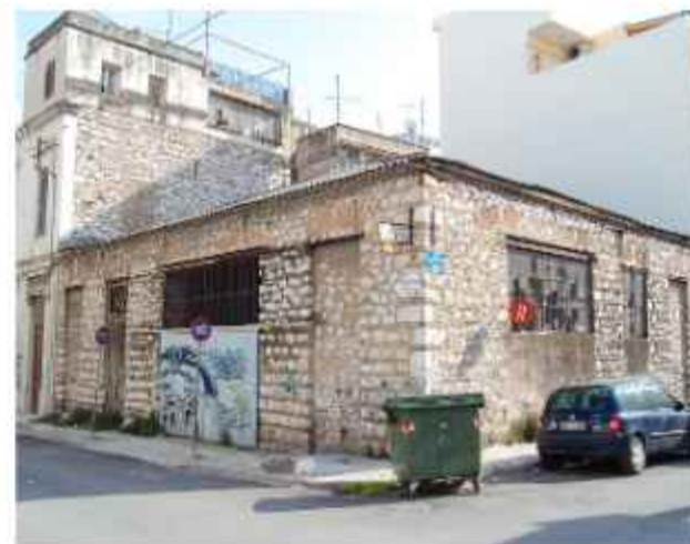
Μηχανουργείο στη συμβολή των οδών Μπουμπουλίνας και Φράττι

Τα κτίρια, κατασκευασμένα τη δεκαετία του '20 περίπου, είναι ορθογώνια πέτρινα κατασκευές στεγασμένα το μεν πρώτο με πλάκα από οπλισμένο σκυρόδεμα, το δε δεύτερο με τετράριχτη σκεπή και έχουν την απλή λειτουργική μορφή που ταιριάζει με τη χρήση για την οποία προορίζονταν.