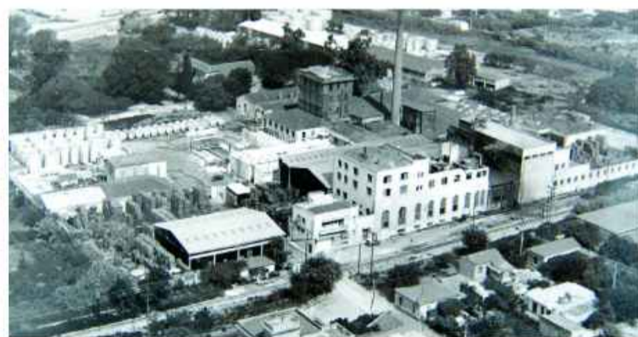
Φωτογραφία από αέρος του συγκροτήματος 5 Ε και ΜΑΜΟΣ σε φωτογραφία των αρχών δεκαετίας του '60

ΕΛΛΗΝΙΚΗ ΕΜΠΟΡΙΚΗ ΕΤΑΙΡΕΙΑ ΕΙΣΑΓΩΓΗΣ - ΕΞΑΓΩΓΗΣ («5Ε») ΜΑΜΟΣ ΑΕ