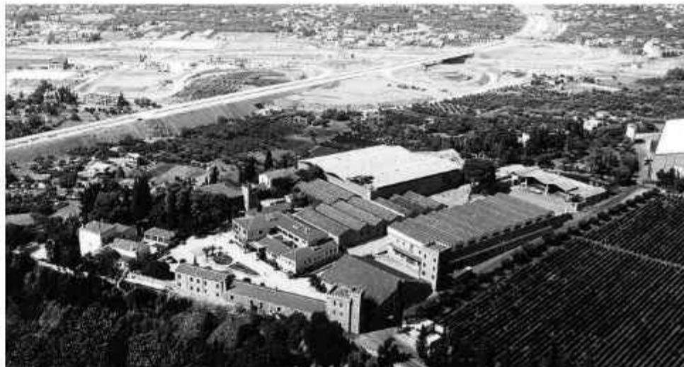
❖ Σύγχρονη άποψη της Αχάια Κλάους από αέρος. Είναι ορατός ο αρχιτεκτονικός πλούτος του ιστορικού συγκροτήματος και η ιδιαίτερη θέση στην περιοχή

Η σύγχρονη παραγωγή έχει πλέον μεταφερθεί σε νέες γειτονικές εγκαταστάσεις και ο παλιός πυρήνας φιλοξενεί τα ιστορικά κελάρια, ορισμένες διοικητικές υπηρεσίες και χώρους υποδοχής επισκεπτών, καθώς η φυσική ομορφιά του τοπίου και η ιστορία της εταιρίας, που είναι η αρχαιότερη ελληνική οινοποιία σε λειτουργία, αποτελεί ένα από τα σημαντικότερα μνημεία της νεότερης ιστορίας.