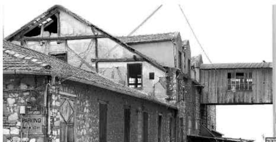
☉ Πλευρική άποψη από την οδό Αστιγγος. Διακρίνεται ο τρόπος δόμησης με παραδοσιακά υλικά και μεθόδους