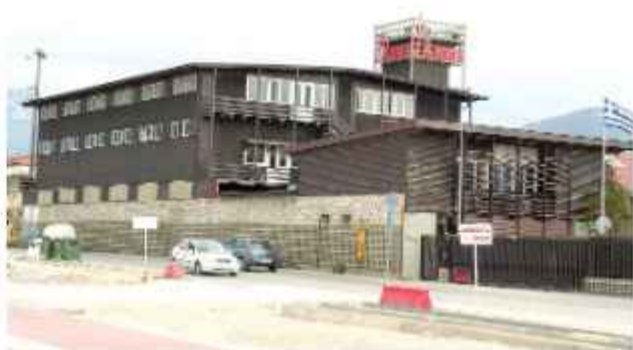
☉ Οι εγκαταστάσεις της ΑΒΕΞ στην Ανθεία. Τα κτίρια που διακρίνονται στεγάζουν κυρίως γραφεία της επιχείρησης

Τη δεκαετία του '80 η επιχείρηση μεταφέρει τις δραστηριότητές της σε νέες εγκαταστάσεις στη Βιομηχανική Περιοχή και οι παλαιές εγκαταστάσεις αποκτούν χαρακτήρα κυρίως αποθηκευτικό.