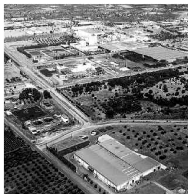
⊕ Αποψη από αέρος της Βιομηχανικής Περιοχής Πατρών