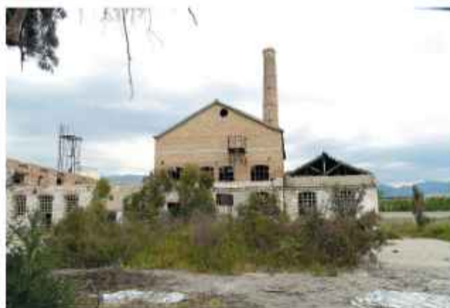
© Τα εναπομείναντα παλαιά πέτρινα κτίρια με την υψικάμμο, μετά την πρόσφατη κατεδάφισή του συγκροτήματος της ΒΕΣΟ Β'

Από τα κτίρια του συγκροτήματος Β' μετά την πρόσφατη κατεδάφισή του, σώζονται τα παλαιά πέτρινα κτίρια με την υψικάμμο ως μοναδικό μάρτυρες της ιστορίας του.