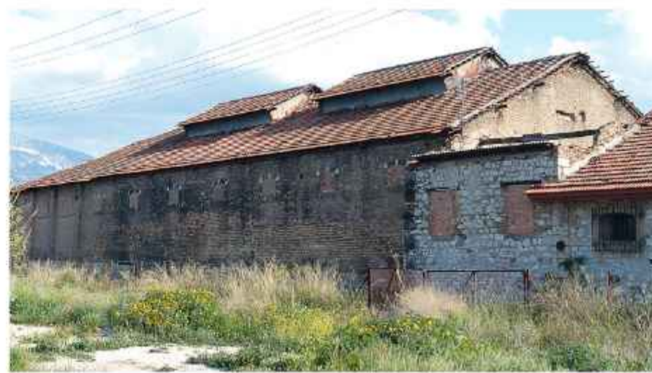
© Το παλιό εργοστάσιο αερίοφωτος (Γκάζι). Εξωτερική άποψη παλαιού κτιρίου που χρησιμοποιεί για αποθηκευτικό χώρο και στέγαση των συνεργείων της ΔΕΥΑΠ

Το 1872 δημιουργήθηκε το πρώτο εργοστάσιο αερίοφωτος κοντά στο ναό του Αγίου Ανδρέα, επί δημάρχου Γ. Μ. Ρούφου, που είχε σχετικά μικρή απόδοση και την εκμετάλλευση του οποίου ανέλαβε από το 1878 η γαλλική εταιρία Φόγγελ.