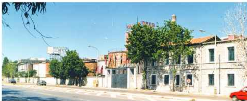
© Η ΒΕΣΟ Α' στην Ακτή Δυμαίων, ένα ακόμα συγκρότημα με σύνθετη διάρθρωση που αποτελείται από κτίρια όλων των φάσεων της εξέλιξής του

Η εταιρία ΒΕΣΟ είναι μία από τις πρώτες και σημαντικότερες που δραστηριοποιήθηκε στη μεσοβρινή παραλιακή πλευρά και αποτελείτο από δύο συγκροτήματα που χωροθετούνταν κατά μήκος της Ακτής Δυμαίων. Το ΒΕΣΟ Α' που οριοθετείται από τις οδούς Σμύρνης και Κυρίλλου Αρχιεπισκόπου και το ΒΕΣΟ Β' σε αρκετή απόσταση, στη θέση «Κρύα» Ιτεών.