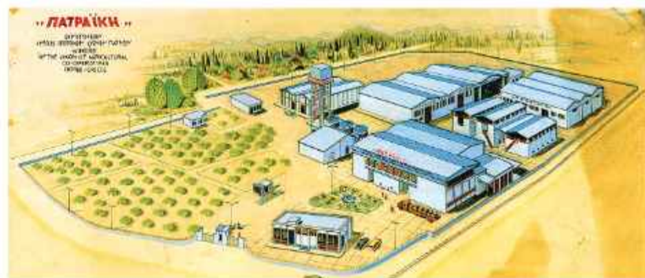
☉ Σχεδιαστική απεικόνιση του συγκροτήματος της «Πατραϊκής Οινοποιίας» από τον Γ. Τσονακίδη

Στην περιοχή της Ανθειας, πάνω από τις σιδηροδρομικές γραμμές, βρίσκεται το ενεργειακό εργοστάσιο της «Πατραϊκής Οινοποιίας», της Ένωσης Γεωργικών Συνεταιρισμών Πατρέων, ο οποίος ιδρύθηκε το 1918.