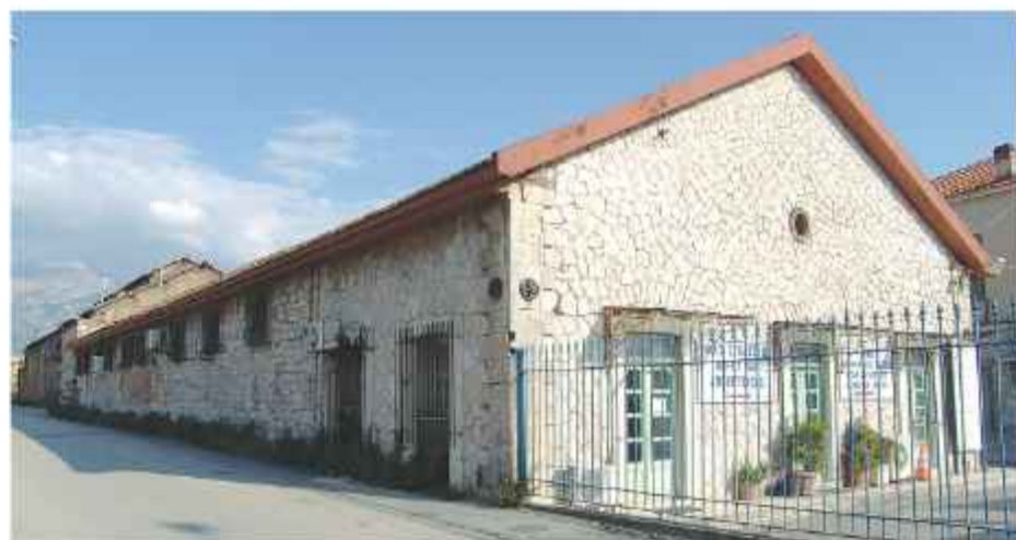
© Το παλιό εργοστάσιο αερίοφωτος (Γκάζι). Κτίριο όπου στεγάζονται οι υπηρεσίες της ΔΕΥΑΠ

σικό ύφος, όπου λειτουργούσαν οι διοικητικές υπηρεσίες. Όντας στην κατοχή του Δήμου Πατρέων φιλοξένησε για δεκαετίες διάφορες χρήσεις, με βασικότερη του εργαστηρίου κατασκευής των καρναβαλικών αρμάτων και στοιχείων, ενώ από τα μέσα της δεκαετίας του '80 αποτελεί την έδρα της ΔΕΥΑΠ (Δημοτική Επιχείρηση Ύδρευσης και Αποχέτευσης).