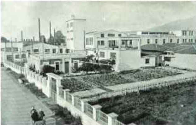
☉ Αποψη της Χαρτοποιίας Λαδόπουλου στα τέλη της δεκαετίας του '30. Διακρίνονται οι αρχικές κτιριακές εγκαταστάσεις χωρίς τις επεκτάσεις των επόμενων δεκαετιών

Το Συγκρότημα της ΕΓΛ αποτελείται από ένα σύνολο κτιρίων που αντιπροσωπεύουν τις διαδοχικές φάσεις ανάπτυξης της επιχείρησης. Στην πρώτη φάση ανήκουν τα πέτρινα κεραμοσκεπή κτίρια που στεγάσαν τις αποθήκες και τα εργαστήρια (μηχανουργεία, ξυλουργεία κ.λπ.) του εργοστασίου και το κεντρικό Συγκρότημα Α κατασκευασμένο από οπλισμένο σκυρόδεμα, όπου γινόταν η παραγωγική διαδικασία.