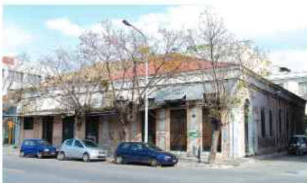
☉ Η σταφιδαποθήκη Μ. Κόλλα. Αποψη από την οδό Όθωνος – Αμαλίας

Μία από τις σταφιδαποθήκες που ακόμη σώζονται στο παραλιακό μέτωπο της Πάτρας, είναι το πέτρινο ισόγειο κεραμοσκεπές κτίριο που βρίσκεται στη νότια πλευρά του οικοδομικού τετράγωνα που ορίζεται από την οδό Παντανάσσης και τις οδούς Αγίου Ανδρέου και Όθωνος - Αμαλίας. Αποτελέσε την έδρα της επιχείρησης του Μιχαήλ Κόλλα, Χιώτη εμπόρου, που τα πρώτα μεταεπαναστατικά χρόνια εγκαταστάθηκε και