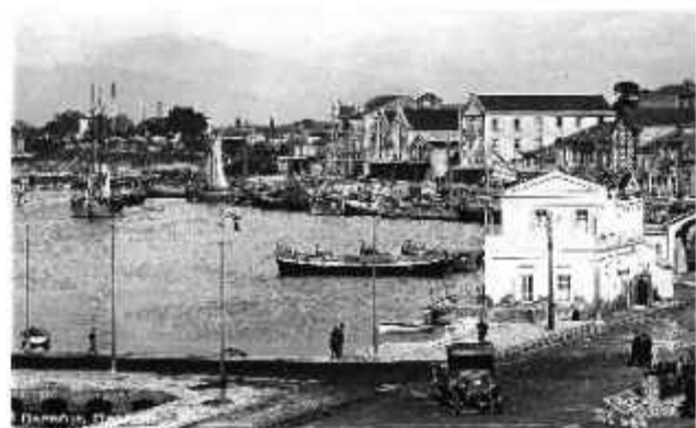
☉ Άποψη της παραλιακής ζώνης με το συγκρότημα των σταφιδαποθηκών και των Μύλων Τριάντη (μετέπειτα Μύλοι Αγ. Γεωργίου) στα τέλη της δεκαετίας του '20.

Στην αρκτική πλευρά του λιμανιού, εκεί όπου η παραλιακή οδός Όθωνος - Αμαλίας συναντά την οδό Νόρμαν, δεσπόζει το συγκρότημα των Μύλων Αγίου Γεωργίου, ένα κτίριο 6 ορόφων των αρχών της δεκαετίας του '30, κατασκευασμένο με οπλισμένο σκυρόδεμα, τυπικό δείγμα του μεσοπολεμικού ευρωπαϊκού μοντερνισμού, στο οποίο μετά το '36 προστέθηκε ο υδατόπυργος και ακόμη ένα κτίριο ανάλογου ύψους, προς την πλευρά της οδού Σανταρόζα, που είχε την χρήση Σιλό. Το συγκρότημα συνδέεται μέσω μεταλλικής γέφυρας μεταφοράς και με την πρώτη από τις Σταφιδαποθήκες του γειτονικού τρίδυμου συνόλου, η οποία χρησίμευε ως χώρος αποθήκευσης και διανομής των αλεύρων. Η αλευροβιομηχανία «Μύλοι Αγίου Γεωργίου» ιδρύθηκε το 1927 με έδρα τον Πειραιά και εγκαταστάθηκε στην Πάτρα το 1936 αγοράζοντας τις εγκαταστάσεις της πτωχευμένης εταιρίας «Κυλινδρόμυλοι Πα-