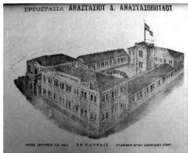
☉ Η εριουργία Α. Δ. Αναστασόπουλου σε απεικόνιση από την εφημερίδα «Νεολόγος» της 27/4/1925

Ένα από τα κατάλοιπα της βιομηχανικής ανάπτυξης του μεσοπόλεμου αποτελεί και το κτίριο της εριουργίας «Α. Δ. Αναστασόπουλου», χαρακτηριστικό δείγμα μεγάλου συγκροτήματος περίκλειστου χαρακτήρα, όπως φαίνεται και σε απεικονίσεις της εποχής, του οποί-