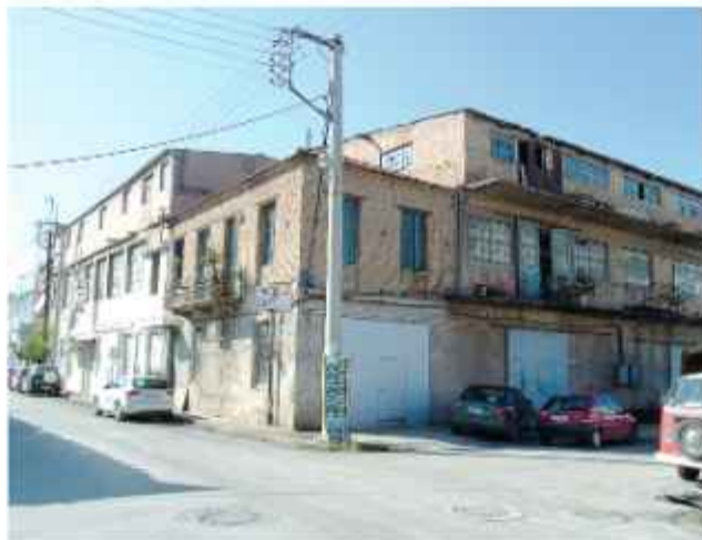
☉ Το κτίριο του παλαιού βυρσοδεψείου του Βασ. Φουσκόπουλου από την οδό Μαιζώνος. Είναι ορατές οι διαδοχικές οικοδομικές φάσεις του εργοστασίου

Στις πρώτες πέτρινες εγκαταστάσεις της δεκαετίας του '20 λειτούργησε το εργοστάσιο επεξεργασίας δερμάτων (βυρσοδεψείο) μέχρι και τη δεκαετία του '70. Τη δεκαετία του '60 περί-