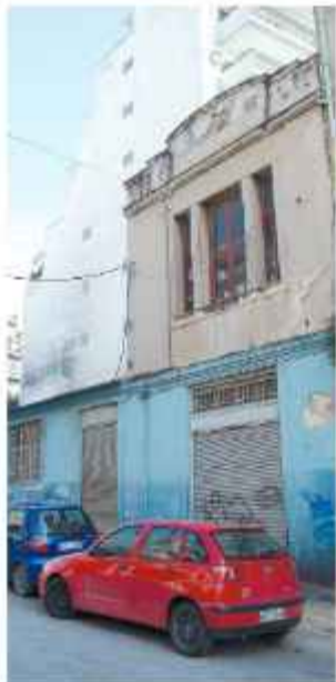
☉ Το κτίριο της παλαιάς σταφιδαποθήκης Δ. Μ. Γεωργόπουλου

Επί της οδού Καρόλου, στον αριθμό 6, στη νότια πλευρά της οδού, βρίσκεται το κτίριο της παλαιάς σταφιδαποθήκης Δ. Μ. Γεωργόπουλου. Οι εγκαταστάσεις της σταφιδαποθήκης αποτελούνται από ένα κεντρικό κτίριο δύο ορόφων κατασκευασμένο στα μέσα της δεκαετίας του '20, που μορφολογικά πλησιάζει στο ύφος art deco, με μία ιδιαίτερη επίστεψη που φέρει ανάγλυφο στο σοβά το όνομα του αρχικού ιδιοκτήτη και ένα ισόγειο κεραμοσκεπές, το οποίο εκτείνεται μέχρι την οδό Καψάλη. Το κτίριο έπαψε να λειτουργεί σαν σταφιδεργαστήριο τη δεκαετία του '60 και μέχρι πρόσφατα στέγαζε μηχανουργείο και συνεργείο αυτοκινήτων.