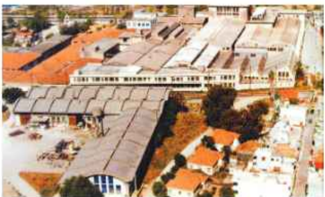
☉ Γενική άποψη του συγκροτήματος ΕΓΛ από την πλευρά των σιδηροδρομικών γραμμών, στις αρχές της δεκαετίας του '80. Διακρίνονται το συγκρότημα Α της δεκαετίας του '20 με τον υπερυψωμένο φεγγίτη και δεξιά του τα κτίρια των προσθηκών των επόμενων δεκαετιών

Ακολουθεί το Συγκρότημα Β της δεκαετίας του '50 και το Συγκρότημα Γ που οικοδομήθηκε μετά το 1960. Πάνω από τις σιδηροδρομικές γραμμές υπάρχει μια μεταγενέστερη επέκταση με κάτοψη Γ που είχε το ρόλο αποθηκευτικών χώρων.