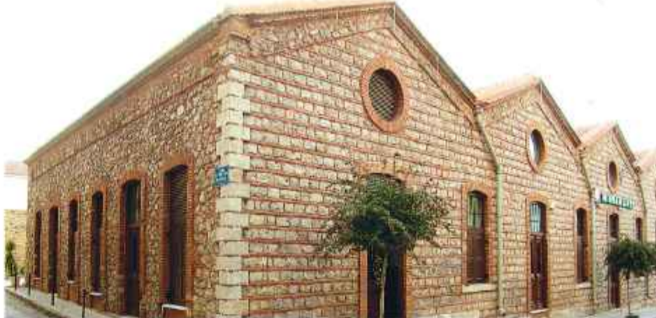
☉ Το εργοστάσιο δερμάτων Γ. Ζαφειρόπουλου – Α. Μενούνου. Αποψη από τη συμβολή των οδών Τσαμαδού και Σπ. Μεταξά