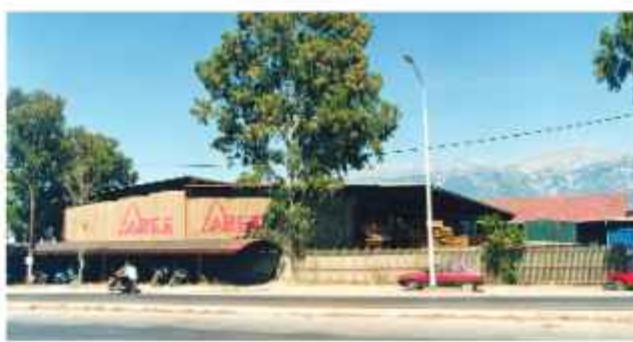
☉ Αποψη των αποθηκευτικών χώρων της ΑΒΕΞ από την Ακτή Δυμαίων