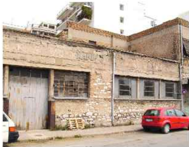
Το παλιό μηχανουργείο - χυτήριο Δ. Π. Σκούρα στην οδό Μαιζώνος αποτέλεσε μία από τις σημαντικότερες μονάδες της Πάτρας σε παραγωγή προϊόντων μεταλλουργίας, εξαρτημάτων μηχανών και μηχανημάτων

δεκαετίας, κατασκευάζονταν προϊόντα μεταλλουργίας, εξαρτήματα μηχανών και μηχανήματα (αντλίες, πιεστήρια κ.λπ.), καθώς επίσης τορπίλες και βόμβες βυθού για το πολεμικό ναυτικό. Το κτίριο είναι σύνθετης μορφής, αποτελείται από τετράγωνους όγκους που διαμορφώθηκαν με διαδοχικές οικοδομικές φάσεις τις πρώτες δεκαετίες του 20ού αιώνα και συνεχίζει να λειτουργεί στεγάζοντας δραστηριότητες σιδηρουργείου.