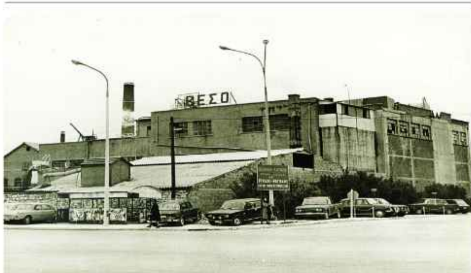
© Η ΒΕΣΟ Β' στη θέση Κρύα Ιτεών, συγκρότημα με σύνθετη διάρθρωση, καθώς αποτελείται από κτίρια όλων των φάσεων της εξέλιξής του. Αποτελέσει αρχικά την έδρα της εταιρείας «Κ. Α. Αλεξόπουλος και Σία». Δεκαετία του '70