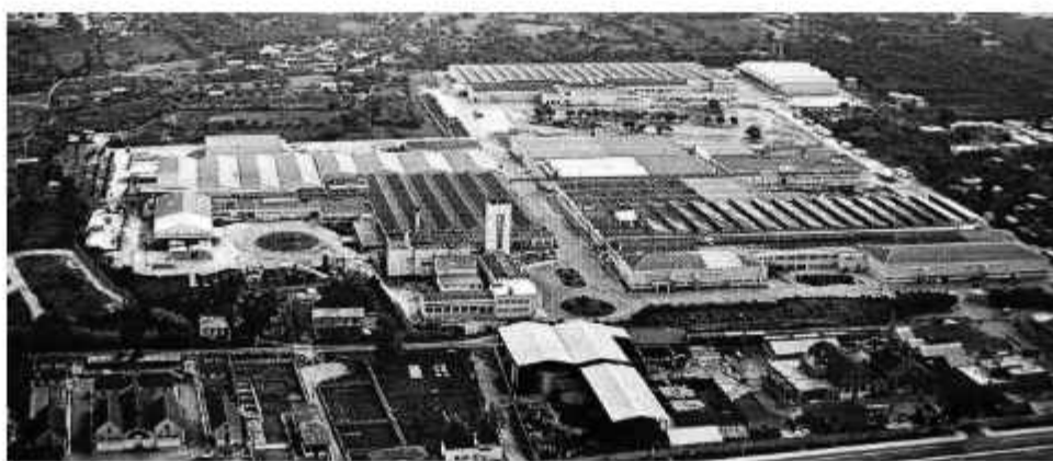
❖ Άποψη του εργοστασίου από αέρος στα τέλη της δεκαετίας του '60. Φωτογραφία από το περιοδικό που εξέδιδε η Πειραιϊκή Πατραϊκή

Οι πρώτες εγκαταστάσεις βρίσκονταν στο οικοδομικό τετράγωνο που περιβάλλεται από τις οδούς Κορίνθου, Γενναδίου, Μαιζώνος και Παπαφλέσσα και αποτελείτο από