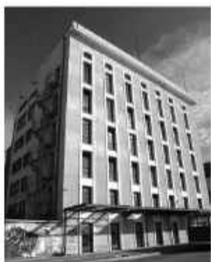
☉ Σημερινή άποψη των Μύλων από την οδό Όθωνος - Αμαλίας

Στην αρκτική πλευρά του λιμανιού, εκεί όπου η παραλιακή οδός Όθωνος - Αμαλίας συναντά την οδό Νόρμαν, δεσπόζει το συγκρότημα των Μύλων Αγίου Γεωργίου, ένα κτίριο 6 ορόφων των αρχών της δεκαετίας του '30, κατασκευασμένο με οπλισμένο σκυρόδεμα, τυπικό δείγμα του μεσοπολεμικού ευρωπαϊκού μοντερνισμού, στο οποίο μετά το '36 προστέθηκε ο υδατόπυργος και ακόμη ένα κτίριο ανάλογου ύψους, προς την πλευρά της οδού Σανταρόζα, που είχε την χρήση Σιλό. Το συγκρότημα συνδέεται μέσω μεταλλικής γέφυρας μεταφοράς και με την πρώτη από τις Σταφιδαποθήκες του γειτονικού τρίδυμου συνόλου, η οποία χρησίμευε ως χώρος αποθήκευσης και διανομής των αλεύρων. Η αλευροβιομηχανία «Μύλοι Αγίου Γεωργίου» ιδρύθηκε το 1927 με έδρα τον Πειραιά και εγκαταστάθηκε στην Πάτρα το 1936 αγοράζοντας τις εγκαταστάσεις της πτωχευμένης εταιρίας «Κυλινδρόμυλοι Πα-