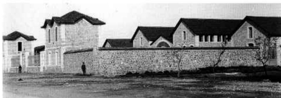
❖ Άποψη του συγκροτήματος των Δημοτικών Σφαγείων στις αρχές του 20ού αιώνα

Στις αρχές του 20ού αιώνα διαπιστώθηκε, από τη δημοτική αρχή του Δημητρίου Βότσι, η ανάγκη δημιουργίας δημοτικών σφαγείων που να εξυπηρετούν τις ανάγκες της περιοχής και να τηρούν τους κανόνες υγιεινής. Για το σκοπό αυτό επιλέχτηκε η κατασκευή τους στη θέση Κρύα Ιτεών επί της Ακτής Δυμαίων.