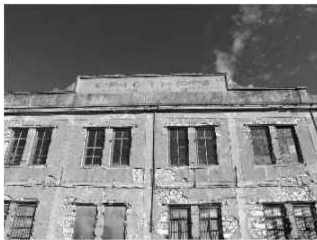
☉ Λεπτομέρεια από τη στέγη της πρόσοψης του εργοστασίου Αναστασόπουλου, όπου στο γέισο αναγράφεται ανάγλυφα στο σοβά η επωνυμία του εργοστασίου