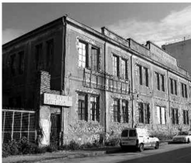
☉ Σημερινή άποψη του εργοστασίου Αναστασόπουλου