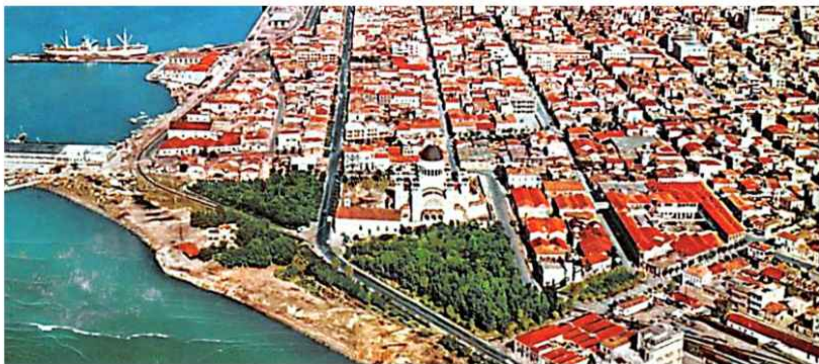
☉ Αεροφωτογραφία τέλη δεκαετίας '50 - αρχές '60. Ευδιάκριτες οι εγκαταστάσεις της «Πειραιϊκής - Πατραϊκής» (Μαιζώνος - Παπαφλέσσα - Κορίνθου)