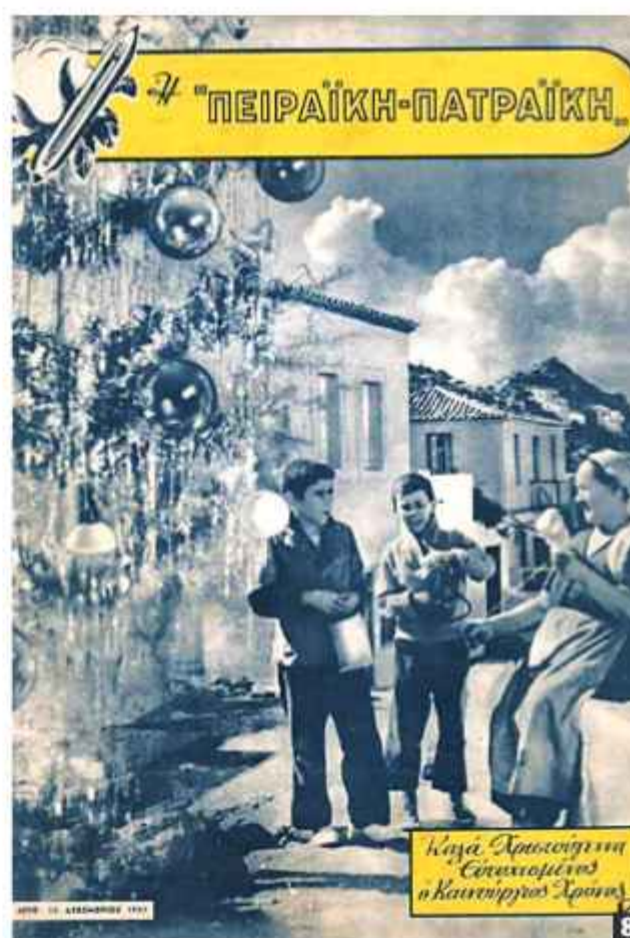
1 Εργάτες το 1961 στην «Πατραϊκή» όπως έλεγαν τότε το εργοστάσιο στην Πάτρα (και «Πειραιϊκή» το της πρωτεύουσας). 2 Στο εργοστάσιο της «Π-Π» τη δεκαετία του '50. Διακρίνονται και οι Βασίλης Βερβίτας, Κωνσταντίνος Κυριαζής. 3 Διαφήμιση στην «Εξπρές» της 2ας Ιανουαρίου 1963. 4 Για δροσιά στο μπαλκόνι, τοντόπανα «Πριμαβέρα». 5 Φυσικά η ούγια έγραφε ένα μόνο πράγμα!. 6 Λεωφορείο της εταιρείας, προφανώς με αμάξωμα Μανδρέκα, φτιαγμένο στα Μποζαίτικα. 7 Δημοσίευμα εποχής για την αρτιότητα των εγκαταστάσεων. 8 Εορταστική έκδοση της Εταιρείας του 1957