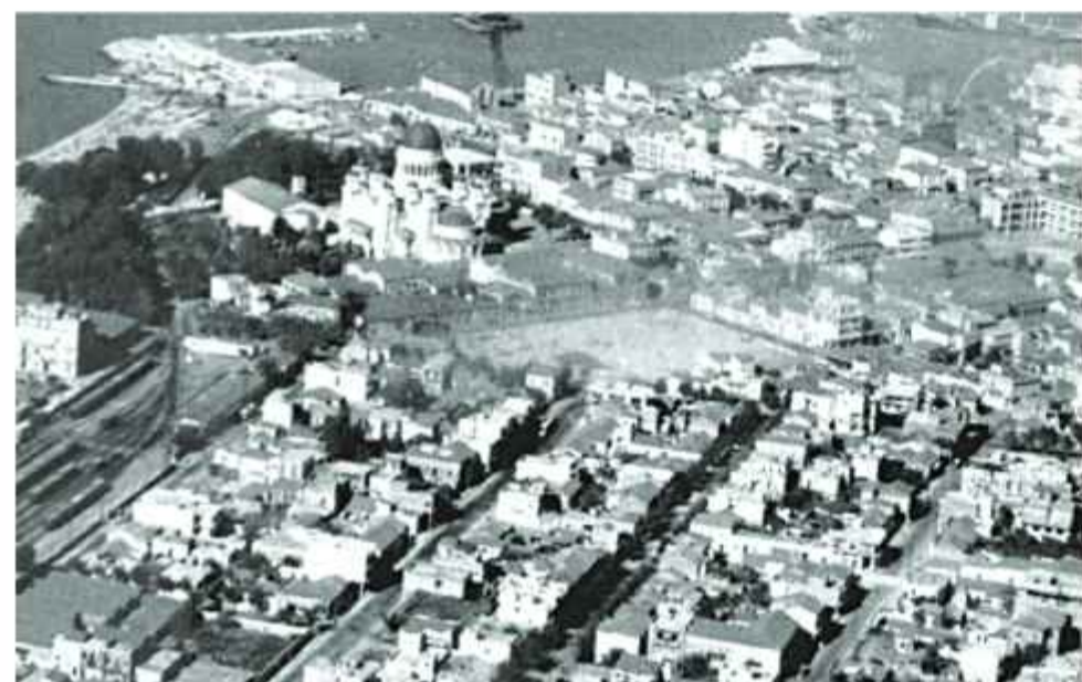
☉ Αεροφωτογραφία στα 60ς. Ορατό το οικοδομικό τετράγωνο που στέγαζε την «Πειραιϊκή - Πατραϊκή» μετά την κατεδάφιση των κτισμάτων. Ορατά και η πρόσοψη της οδού Μαιζώνος που στεγάζει πλέον την «Π»

Την δεκαετία του 1960 η Π-Π διαθέτει πέντε σύγχρονες εργοστασιακές μονάδες και απασχολούσε περισσότερους από 4.000 υπάλληλους. Στη δεκαετία 1970-1980 η εταιρεία επεκτείνεται (Πάτρα, Αθήνα, Μ. Πεύκο, Χαλκίδα, Καρπενήσι, Φιλιάτες, Σύρος, Σάμος) και απασχολεί πλέον 5.000 εργαζόμενους στην Πάτρα και 7.000 σε όλη την Ελλάδα. Στη δεκαετία του 1970 αρχίζει η κρίση και καθίσταται αναπόφευκτη η κρατικοποίηση της στην πρώτη 4ετία της κυβερνήσεως του Ανδρέα Παπανδρέου. Μετά το 1989, αυξήθηκαν τα χρέη και η κακοδιαχείριση, ακολουθούμενη από βίαιες προσπάθειες «εξυγίανσης» που όμως συνάντησαν την σφοδρή αντίδραση των εργαζομένων. Τελικά η «Πειραιϊκή-Πατραϊκή» έκλεισε τον Οκτώβριο 1992. Αφησε χρέη 235 δισεκατομμυρίων δραχμών.