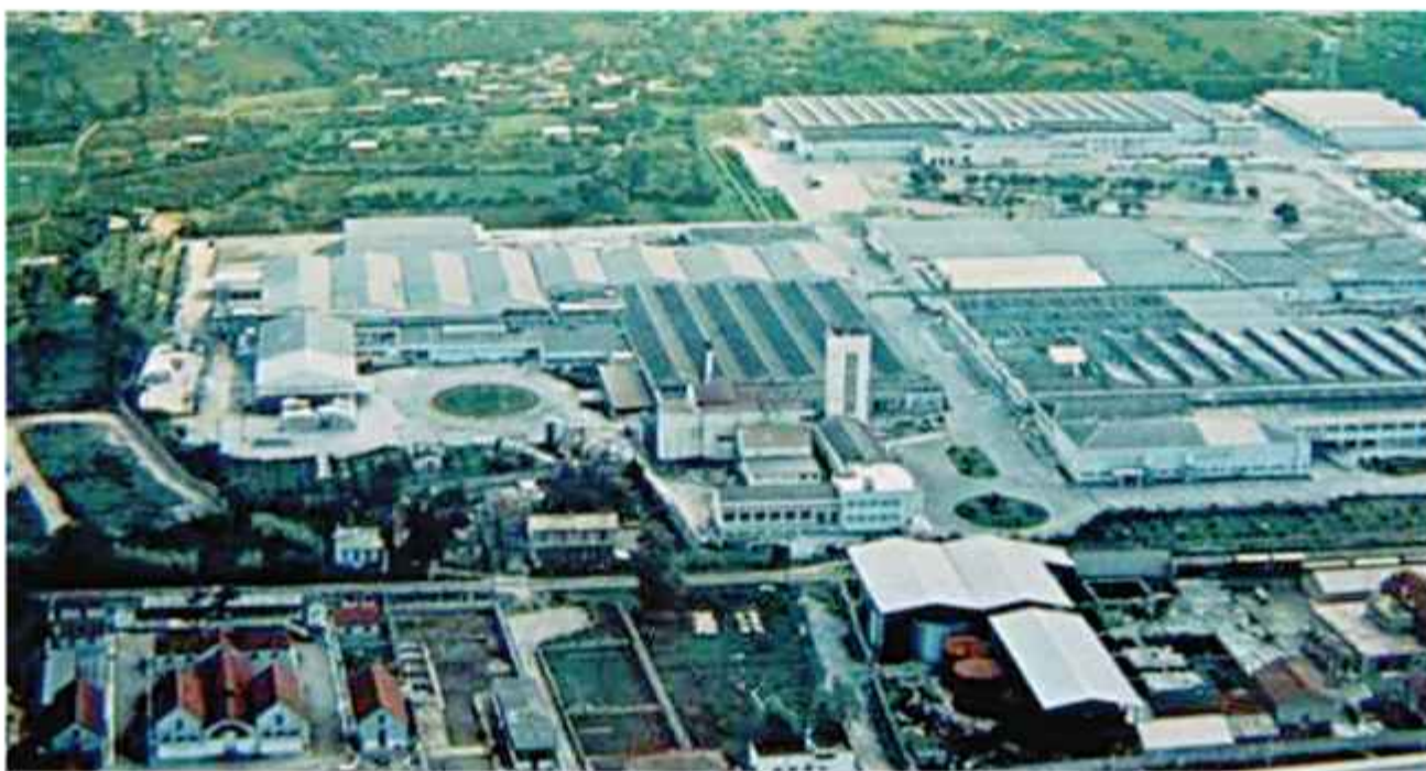
☉ Πλάνο της εγκατάστασης

ση της νέας εταιρείας, αγόρασαν μερικές χειροκίνητες καλτομπχανές και ασχολήθηκαν με τη βαφή και την εκτύπωση μανδηλίων (τοσμπέρια), τα οποία φορούσαν οι γυναίκες