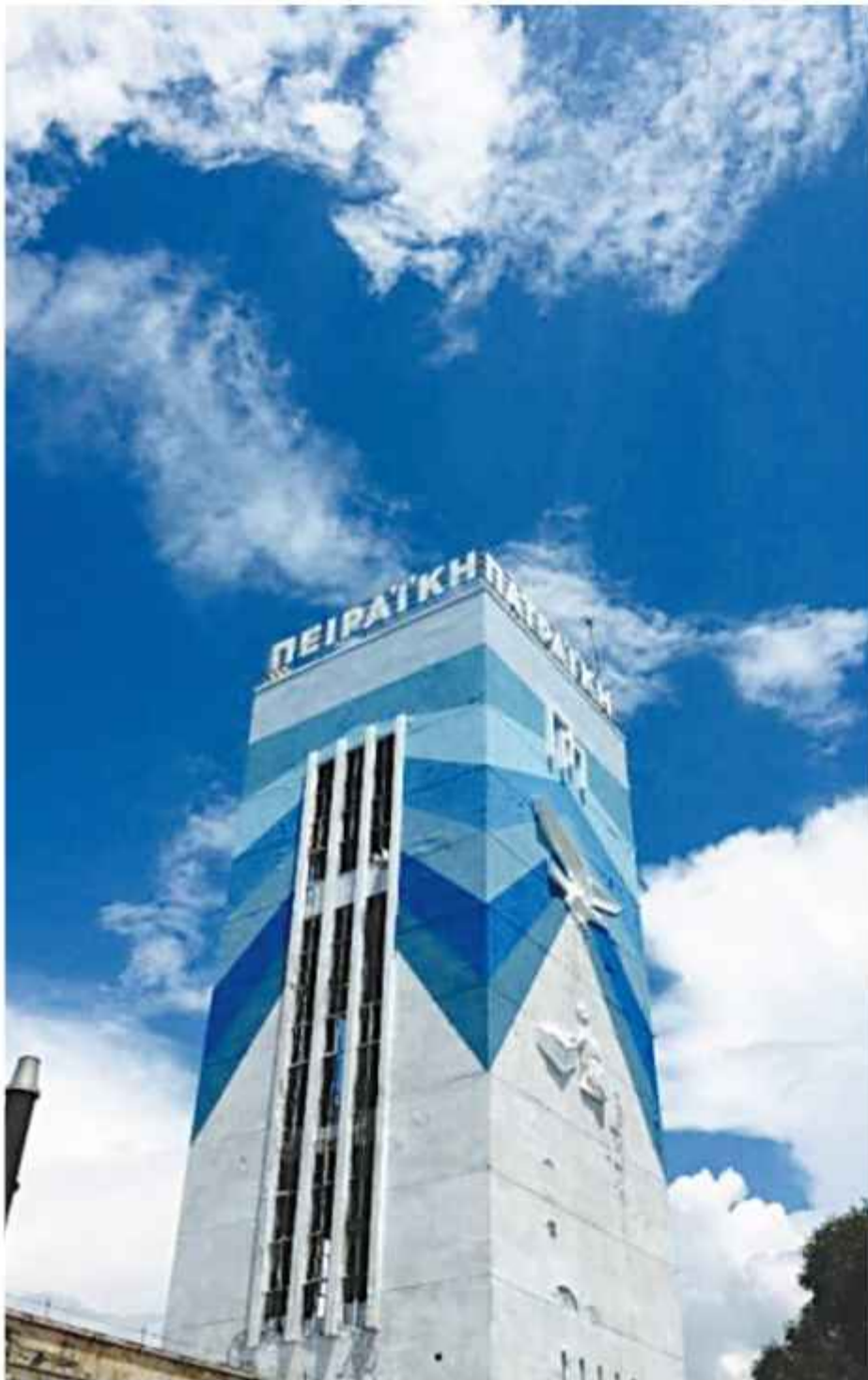
Τουλάχιστον απέκτησε χρώμα, το από κάθε άποψη μουντό εδώ και 30 χρόνια, κτίριο της «Π-Π»