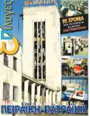
Τεύχος για την «Πειραική - Πατραϊκή» (7/3/2015)