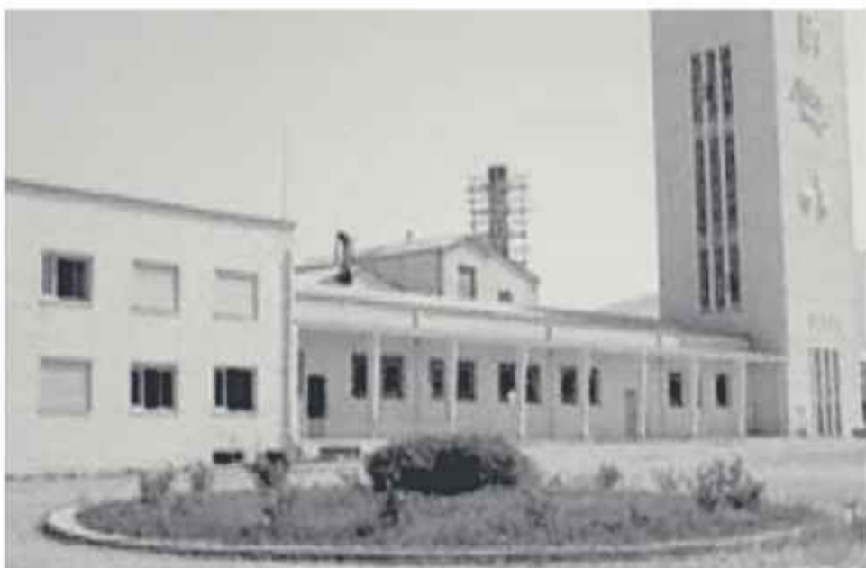
☉ Το προαύλιο της εγκατάστασης από το Εθνικό Οπτικοακουστικό Αρχείο στα 1958