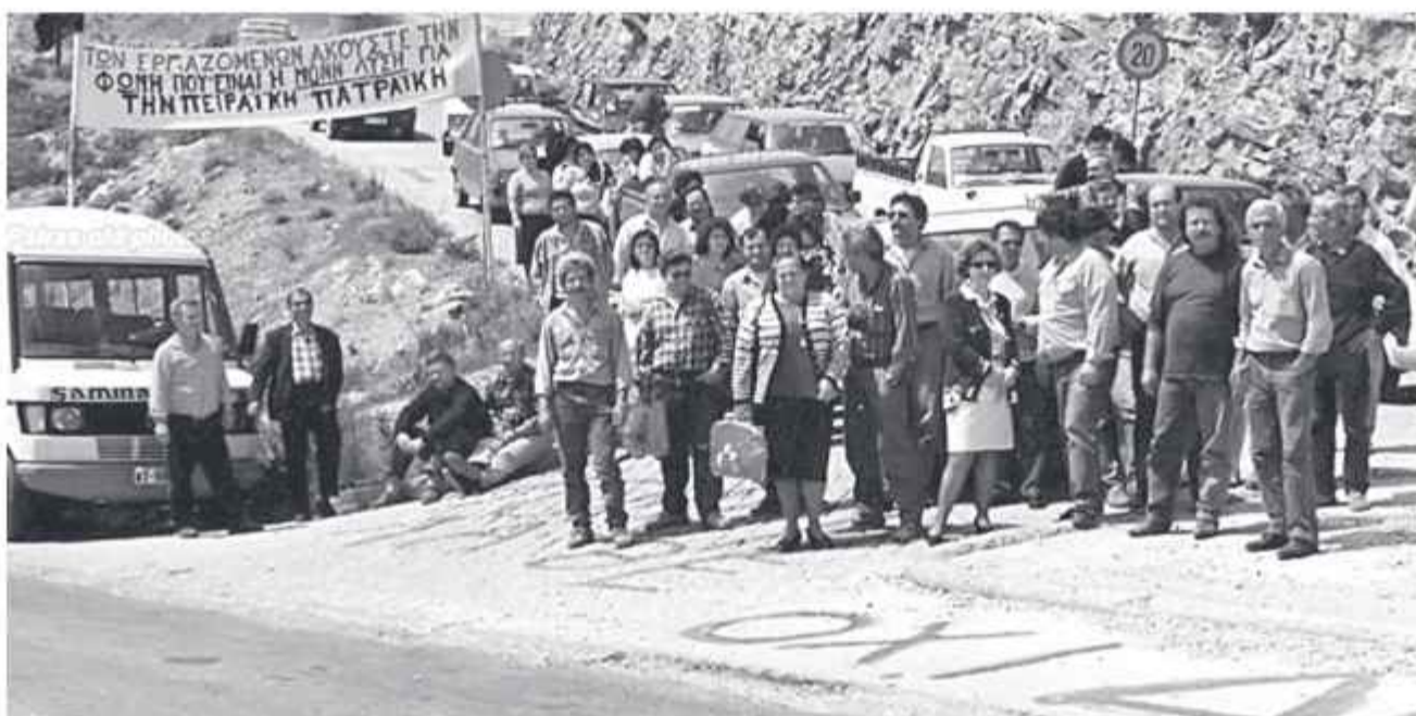
Από διαμαρτυρία εργαζομένων στην «Π-Π»