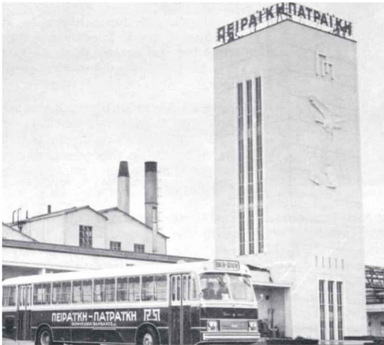
☛ Το λεωφορείο μεταφοράς εργατών έξω από την «Π-Π» κάπου στα '70ς (Bus oldtimers and rebuilders)

Δυστυχώς τα «κουρέλια» δεν τραγουδάνε ακόμα ή εν πάση περιπτώσει θα ξανατραγουδήσουν εάν κι εφόσον ολοκληρωθεί η μετατροπή του «κουφαριού» της «Π-Π» σε σύγχρονο διαμετακομιστικό κέντρο από τον ΟΛΠΑ, στον οποίο και ανήκει εδώ και πολλά χρόνια.