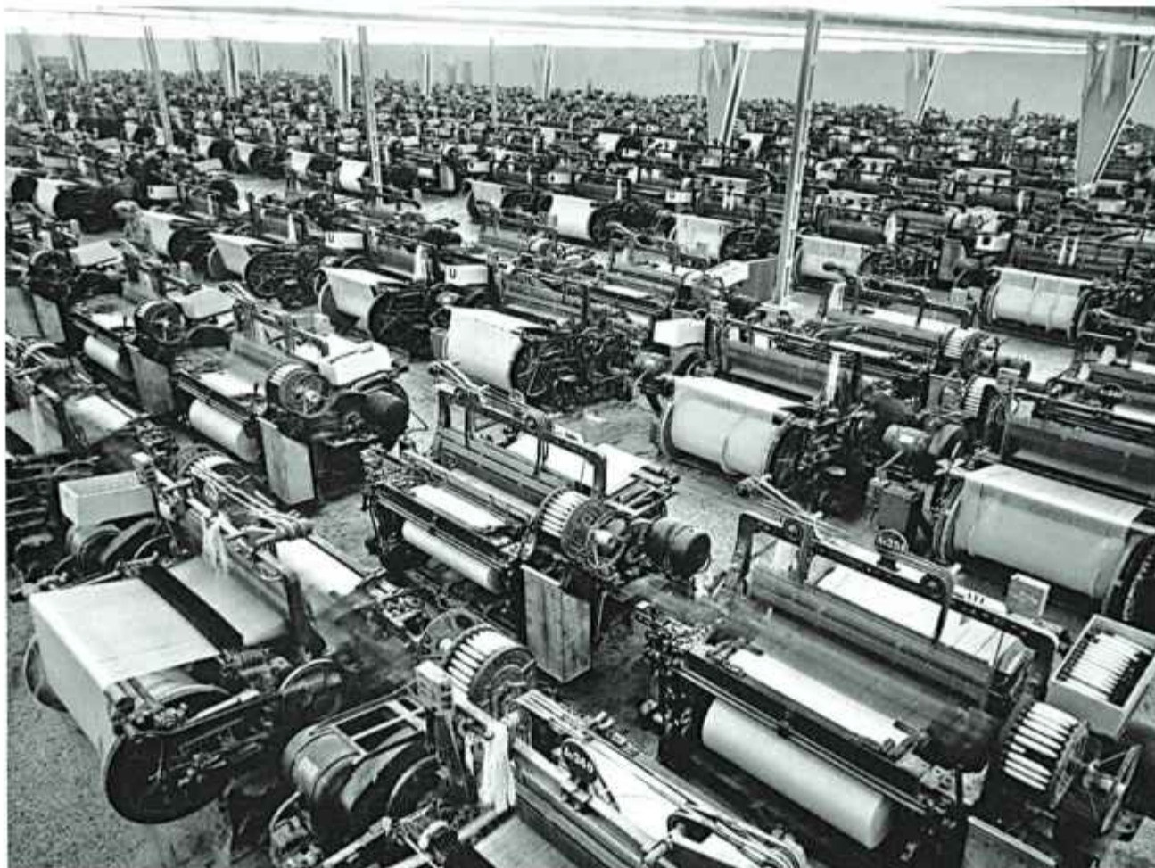
☉ Το υφαντήριο της εταιρείας...