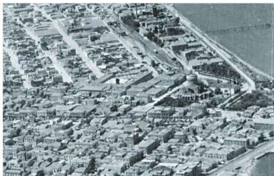
☉ Αεροφωτογραφία του 1955. Μισοτελειωμένος ο τρούλος του Αγίου Ανδρέα, σε πλήρη ανάπτυξη το εργοστάσιο της «Πειραιϊκής - Πατραϊκής»