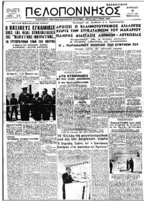
Τρία μεγάλα ρεπορτάζ στην 1η σελίδα της «Π» (9/5/1965)