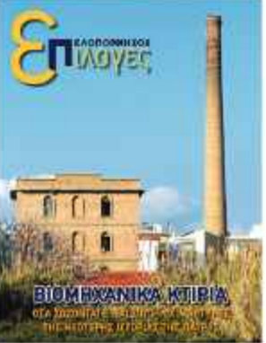
Αφιέρωμα στα απομνηνάρια της Βιομηχανικής Πάτρας (18/10/214)

Με το ανά χείρας τεύχος των «Επιλογών» της, η «Π» συνεχίζει τα αφιερώματά της στην Πειραική - Πατραϊκή, με τον 4ο κατά σειρά «σταθμό» στο οδοιπορικό της. Τα τρία προηγούμενα τεύχη είναι διαθέσιμα στα γραφεία μας (Μαιζώνος 206 και Παπαφλέσσα - εκεί όπου κάποτε «χτυπούσε η καρδιά» της ιστορικής βιομηχανίας.