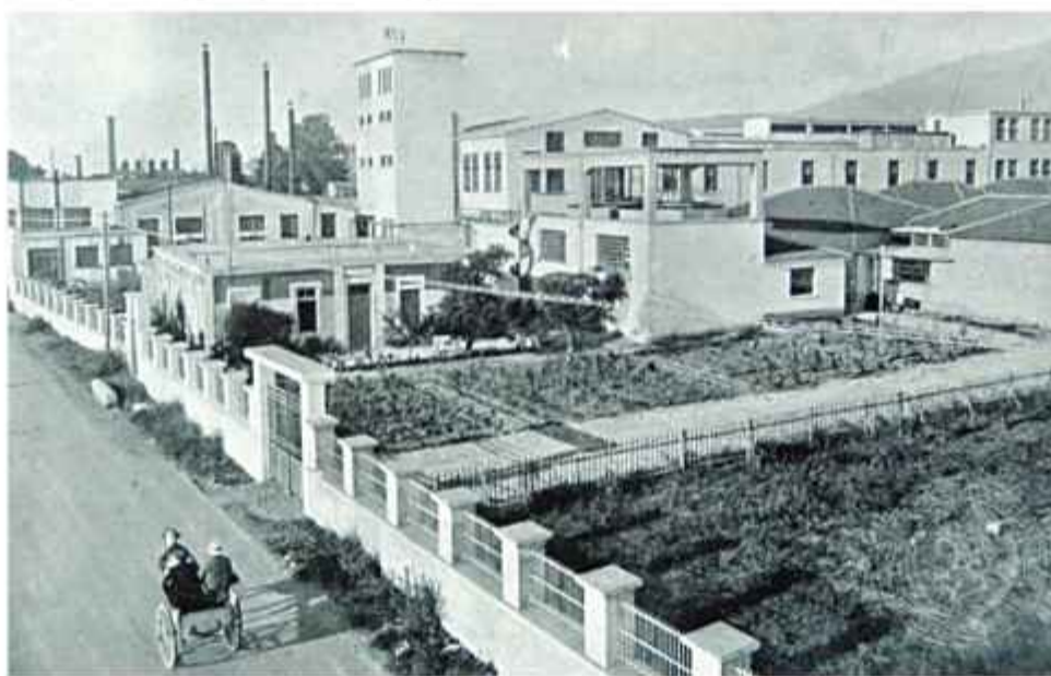
Κι ένα κάρτο μπροστά το εργοστάσιο