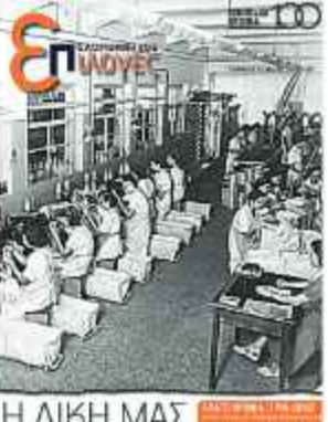
Η ιστορία των Βιομηχανών Πάτρας (12/5/2018)