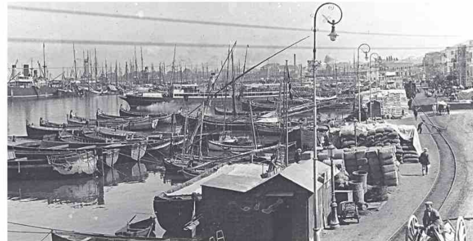
● Η λιμενική δραστηριότητα έπαιξε πρωτεύοντα ρόλο στην ακμή της βιομηχανίας της Πάτρας (κάρτα - ποστάλ εποχής, περίπου στα 1929)

Τον 19ο αιώνα η βιομηχανική επανάσταση της Δύσης φέρνει ως αποτέλεσμα τη διамόρφωση παρόμοιων καταστάσεων στην Ελλάδα. Αρχικά παρατηρείται μια «μη-