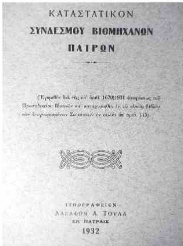
Η έκδοση του τροποποιημένου καταστατικού έγινε στην Πάτρα το 1932

Στο άρθρο 3 του καταστατικού περιγράφεται ο σκοπός του: «Σκοπός του Συνδέσμου είναι η διά παντός ναμίμω και προσφόρου μέσωσ ενίσχυσης και ανάπτυξης της Βιομηχανίας και εν γένει των παραγωγικών εργασιών του τόπου, η προστασία και προαγωγή των οικονομικών και επαγγελματικών συμφερό-