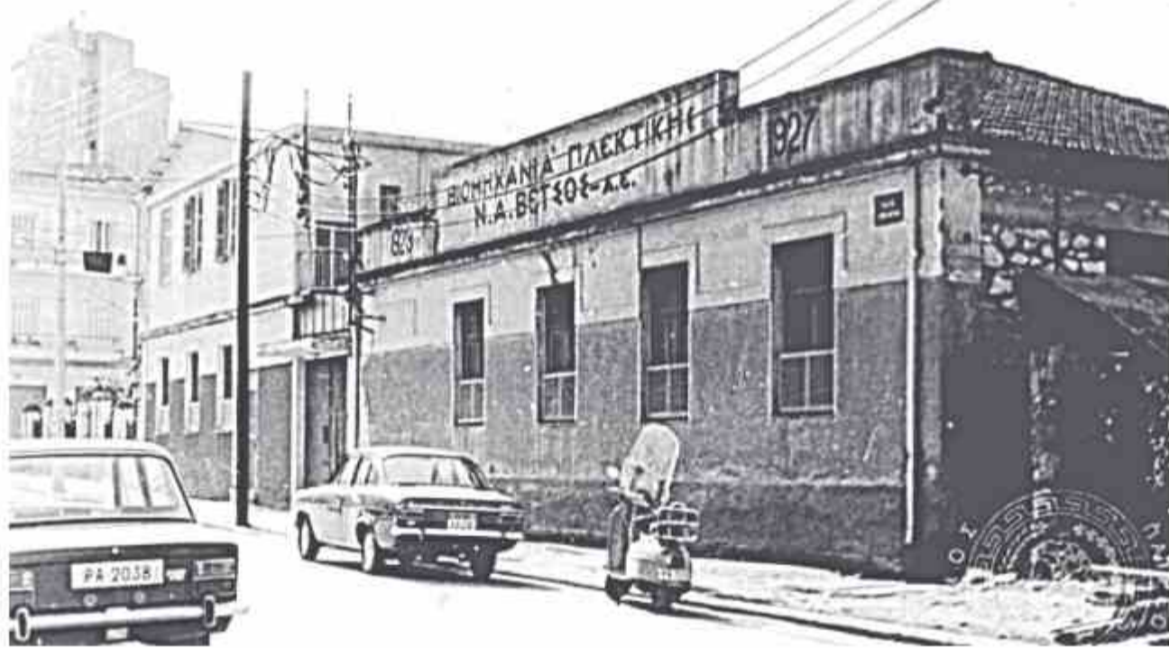
© Το εργοστάσιο στην οδό Ασπμάκη Φωτίλα και Λόντου πριν από πολλά χρόνια

Σε πρώτη φάση φαίνονται οι εργάτριες οι οποίες φτιάχνουν κάλτσες (η συγκεκριμένη βιοτεχνία ήταν η πρώτη στην Ελλάδα που κατασκεύασε νάιλον κάλτσες), ενώ μετά από αυτή τη γραμμή παραγωγής ακολουθεί ο «φούρνος» (στη γωνία) όπου