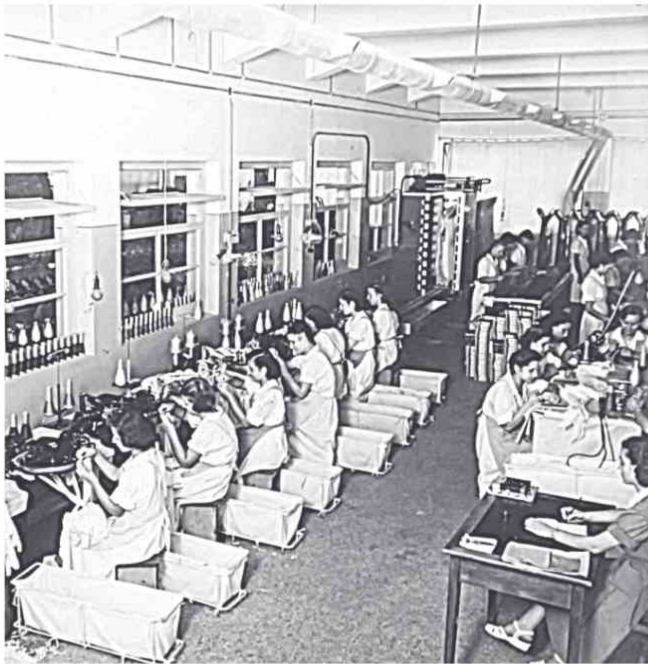
☉ Εν ώρα εργασίας στη Βιομηχανία πλεκτικής Βέτσου το πρώτο μισό της δεκαετίας του '50

ΠΡΟΣΩΠΑ, ΦΩΤΟΓΡΑΦΙΕΣ, ΔΗΜΟΣΙΕΥΜΑΤΑ... ΣΥΝΘΕΤΟΥΝ ΟΛΑ ΜΑΖΙ ΤΟ ΨΗΦΙΔΩΤΟ ΜΙΑΣ ΕΠΟΧΗΣ, ΚΑΤΑ ΤΗΝ ΟΠΟΙΑ Η ΠΟΛΗ ΔΙΑΚΡΙΘΗΚΕ ΓΙΑ ΤΟ ΕΠΙΧΕΙΡΗΜΑΤΙΚΟ ΤΗΣ ΔΑΙΜΟΝΙΟ