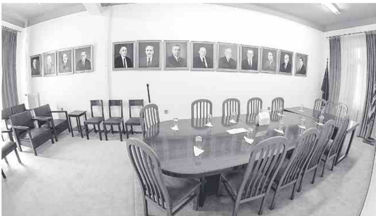
Η αίθουσα συνεδριάσεων στα γραφεία του ΣΕΒ

Ετσι αναλαμβάνει ο Σύνδεσμος να αναβαθμίσει την συνεργασία και τον διάλογο της Βιομηχανίας με την Πολιτεία, τις άλλες παραγωγικές και κοινωνικές ομάδες, να προβάλλει την πολυδιάστατη προσφορά της ιδιωτικής πρωτοβουλίας στην ευημερία του κοινωνικού συνόλου και να προσπίσει το δικαίωμα της ελευθερίας του «επιχειρείν», ως ένα από τους θεμελιώδεις θεσμούς που καταξιώνουν τις δημοκρατικές κοινωνίες και οικονομίες.