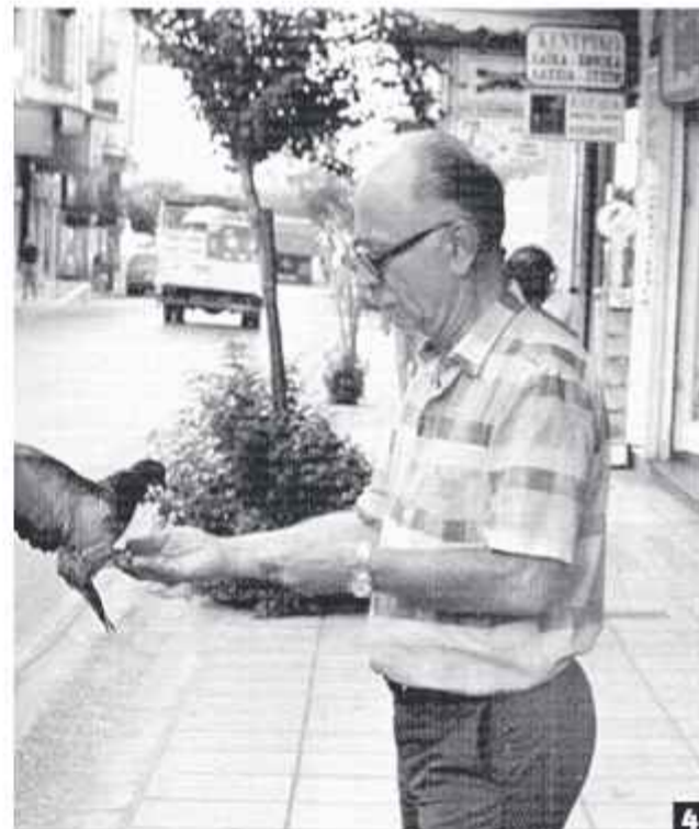
1 Η ποτοποιία Π. Αγουριδίδη (σήμερα κατεδαφισμένη) από τις παλαιότερες των Πατρών καθώς ιδρύθηκε από τον Αντώνη Αγουριδίδη το 1893 2 Φωτογραφία τραβηγμένη τον Ιούνιο του 1992, από το αρχείο της Νανάς Κωτσοπούλου. Βρισκόταν δίπλα στον Μουστάκη 3 Θεε φρεσκοτυπωμένη τοπική εφημερίδα, θεε περιοδικά, θεε σοκολάτες, μπύρες ή εκείνο το αφράτο τσουρεκάκι (Ναι, εκκείνο στο διάφανο σακουλάκι, κλεισμένο με συρραπτικό!). Όλο και κάτι θα είχαν αγοράσει -οι μεγαλύτεροι- απ' τα χεράκια του. Σφηνωμένος στο κάδρο του, με κορνίζα από αναπτήρες BIC, καραμέλες βουτύρου ΙΟΝ, κομπολόγια, καρτ ποστάλ με το άνθινο ρολόι, το αγαλματάκι του Σάτυρου και φόντο τα τοιγάρα. Στο βάθος δεξιά προφυλακτικά STOP, με ταυτόχρονο κλείσιμο του ενός ματιού... Το περίπτερο του Σταθμού του ΟΣΕ στην Αγίου Ανδρέου. Ούτε μια μέρα, ούτε μια νύχτα, από τα μέσα της δεκαετίας του '50 δεν έκλεισε ποτέ! Στη φωτογραφία ο Ανδρέας Σαράντης στο πόστο του από το 1989, συντροφιά πάντα με ένα ραδιοφανάκι... (αρχείο Αρη Μπετχαβά) 4 Ο Γιώργος Αποστολάκος, από τους πιο κομψούς και σπορτίβ Πατρινούς, έμενε ψηλά στην Γ. Ρούφου. Διατηρούσε στέλη σε καθημερινή τοπική εφημερίδα όπου σχολίαζε την πολιτική και κοινωνική κατάσταση με ψευδώνυμο...