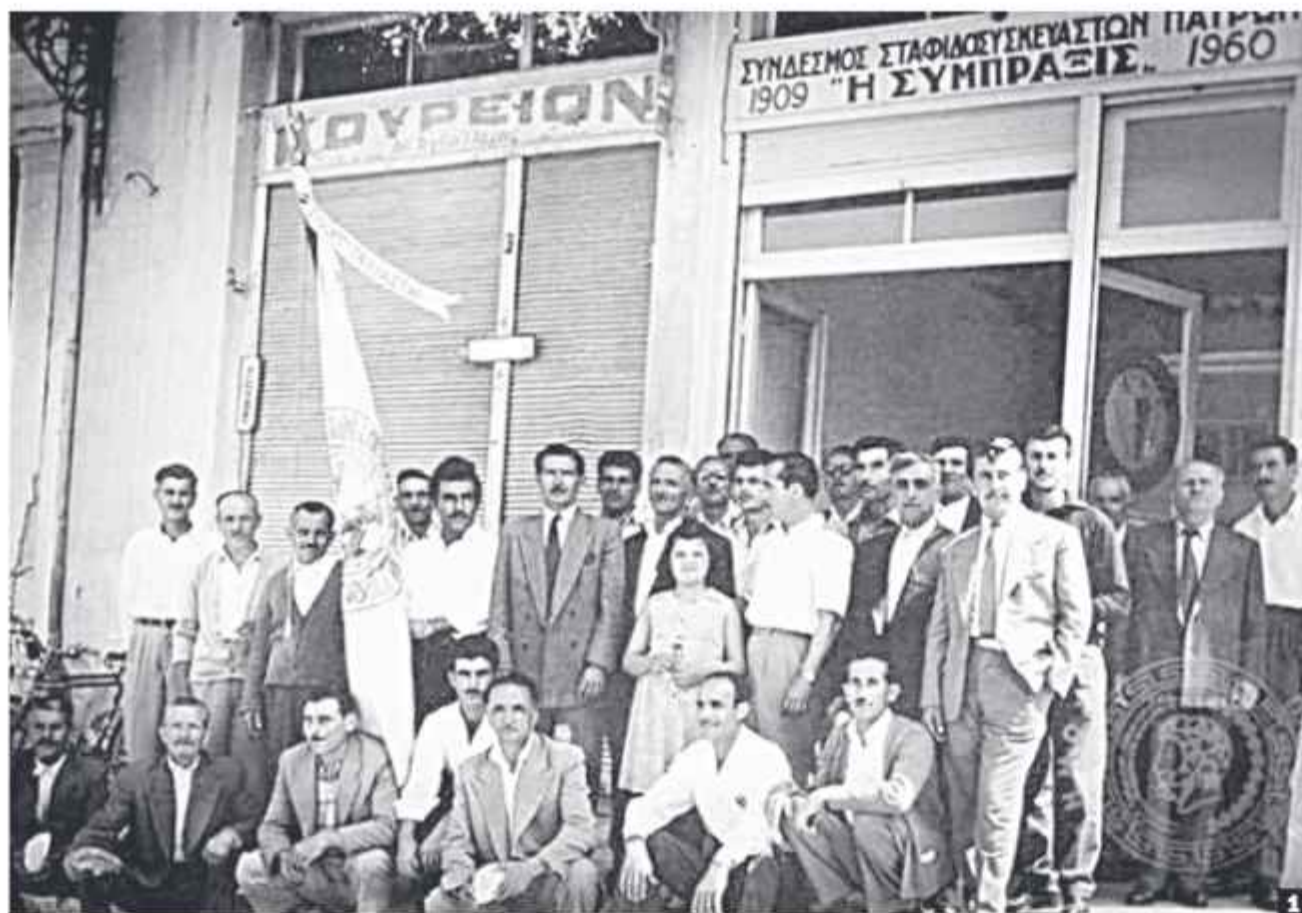
1 Σύναξη σταφιδосуσκευαστών περί το 1960

ΑΣ ΘΥΜΗΘΟΥΜΕ ΜΕΡΙΚΑ ΠΑΛΙΑ ΜΑΓΑΖΙΑ ΤΗΣ ΠΑΤΡΑΣ