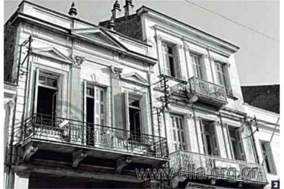
Πάτρα: 'Οδός 'Αγίου Νικολάου